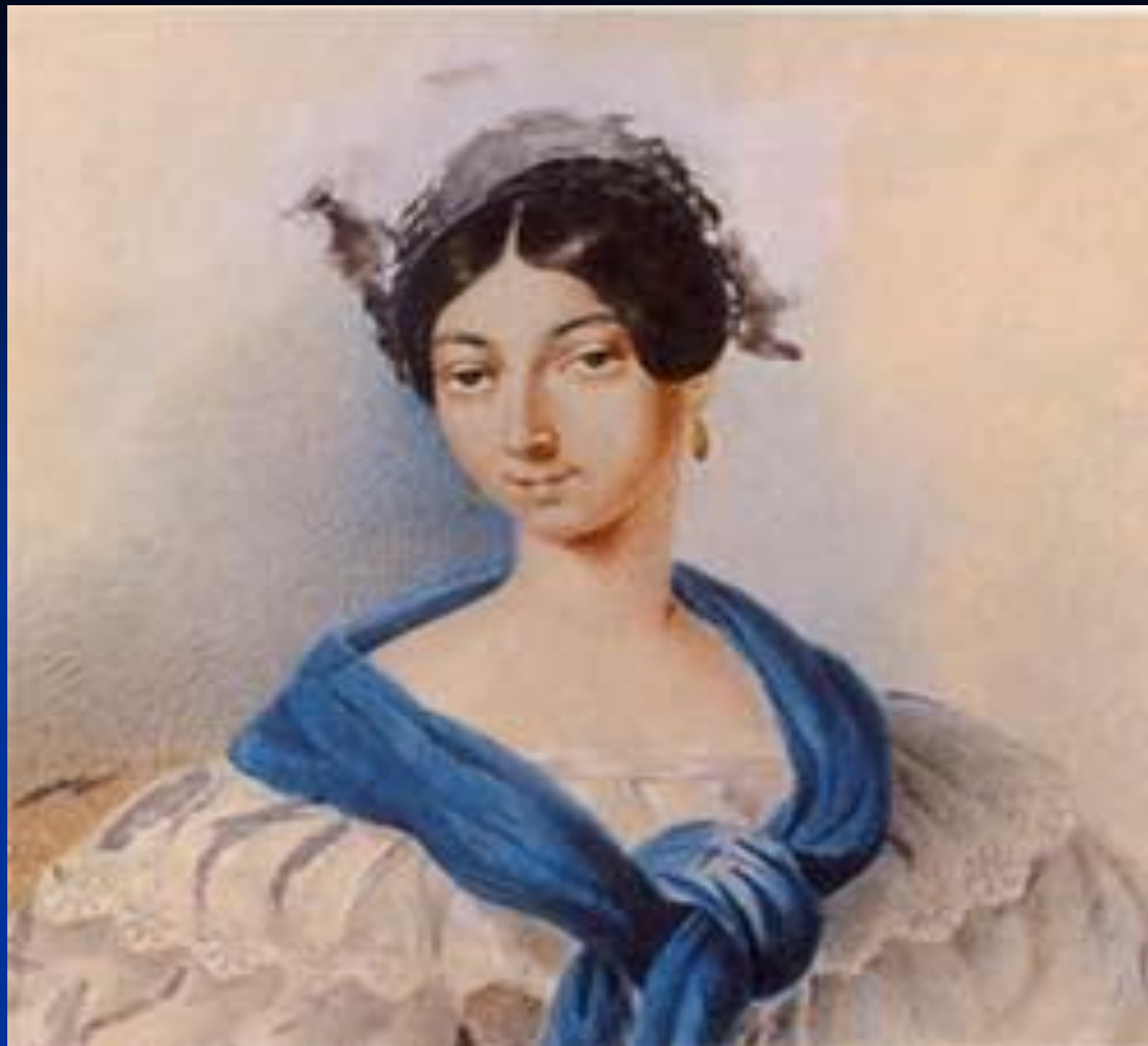
Павлищева Ольга Сергеевна, рожд. Пушкина (1797-1868) — сестра поэта.