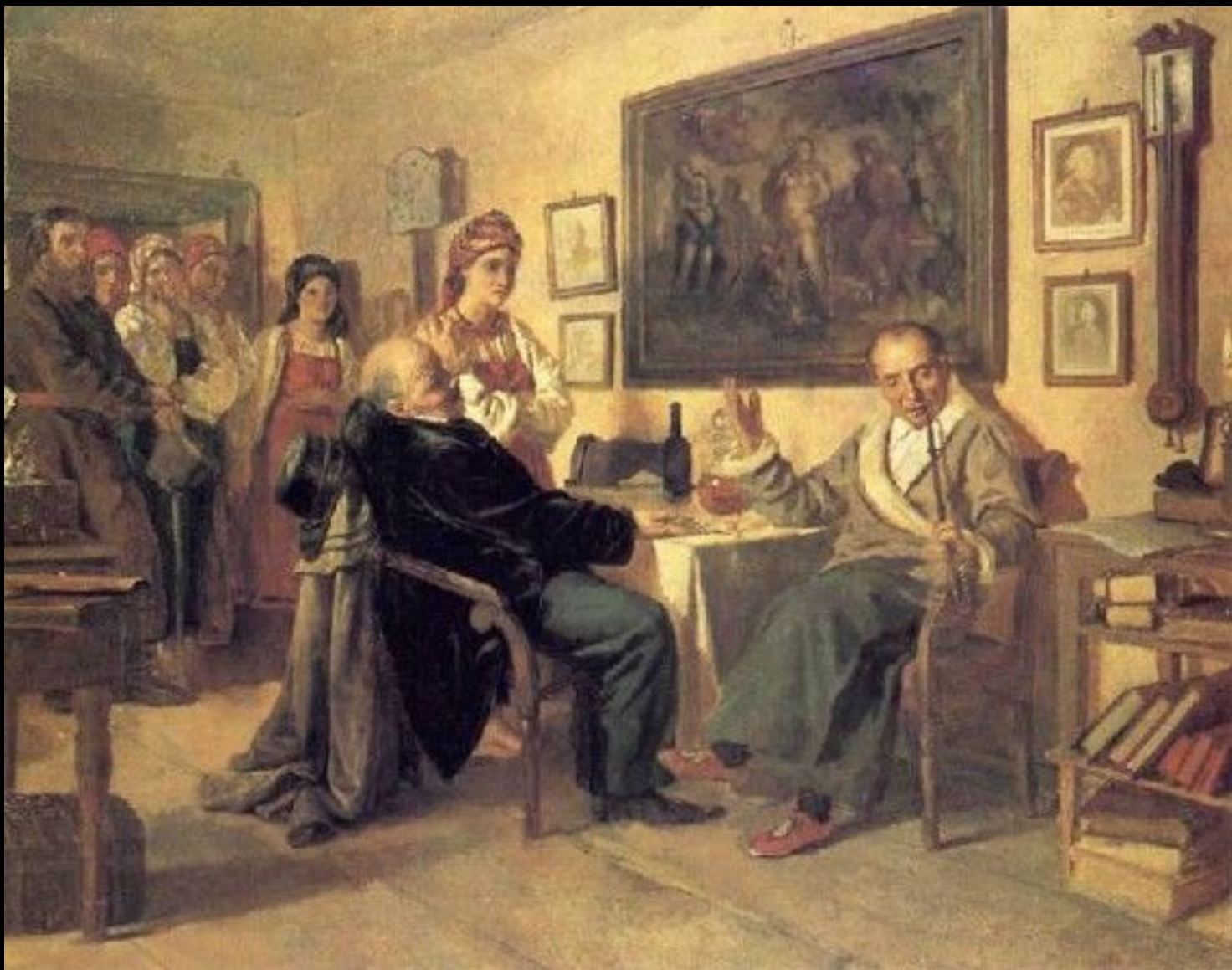
Торг. Худ. Н. Евреев