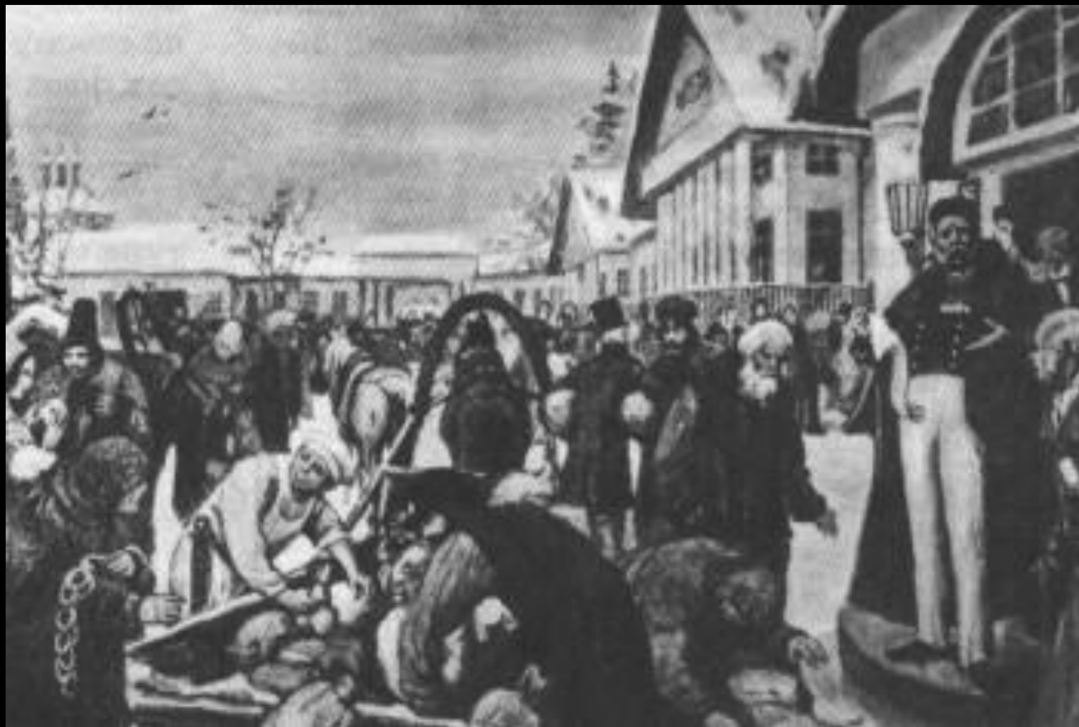
Привоз крепостными провизии Худ. М. Зайцев