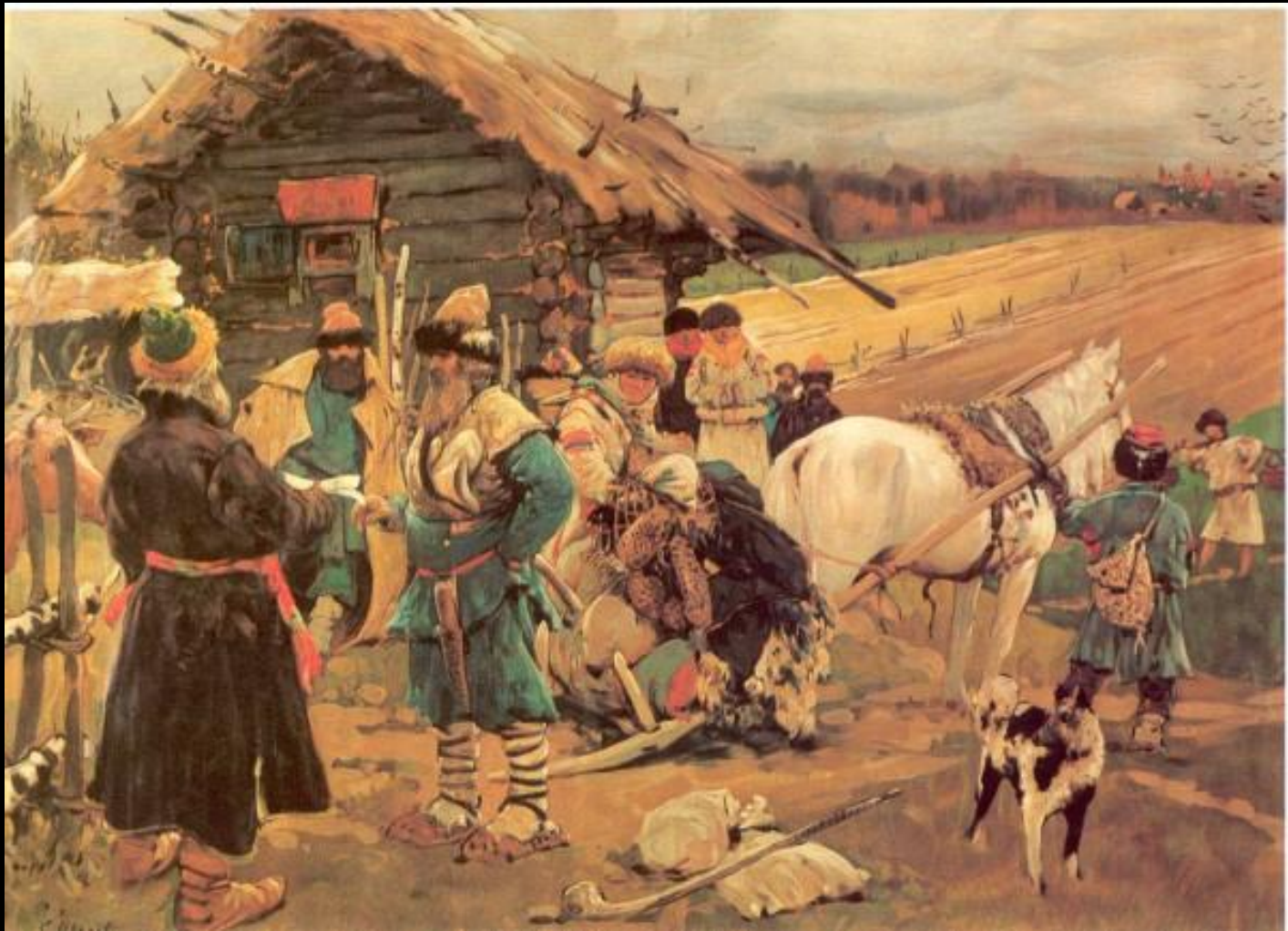
Юрьев день Худ. С. Иванов