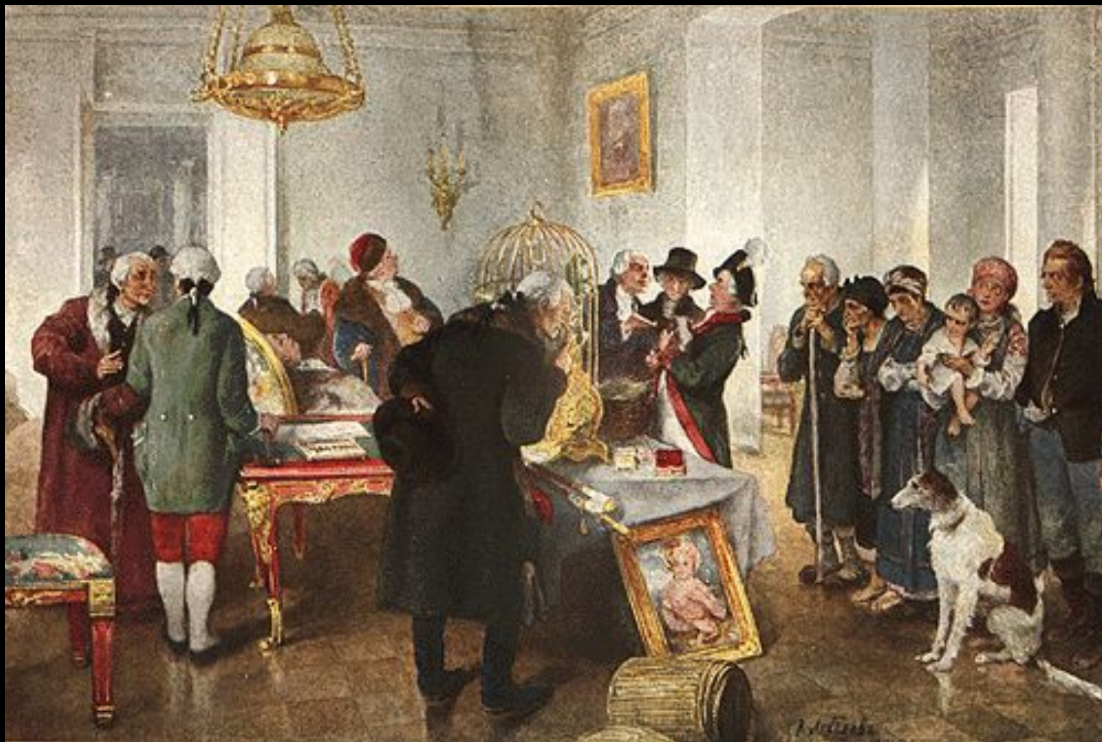
Аукцион по продаже крепостных, Россия, 1825-й год