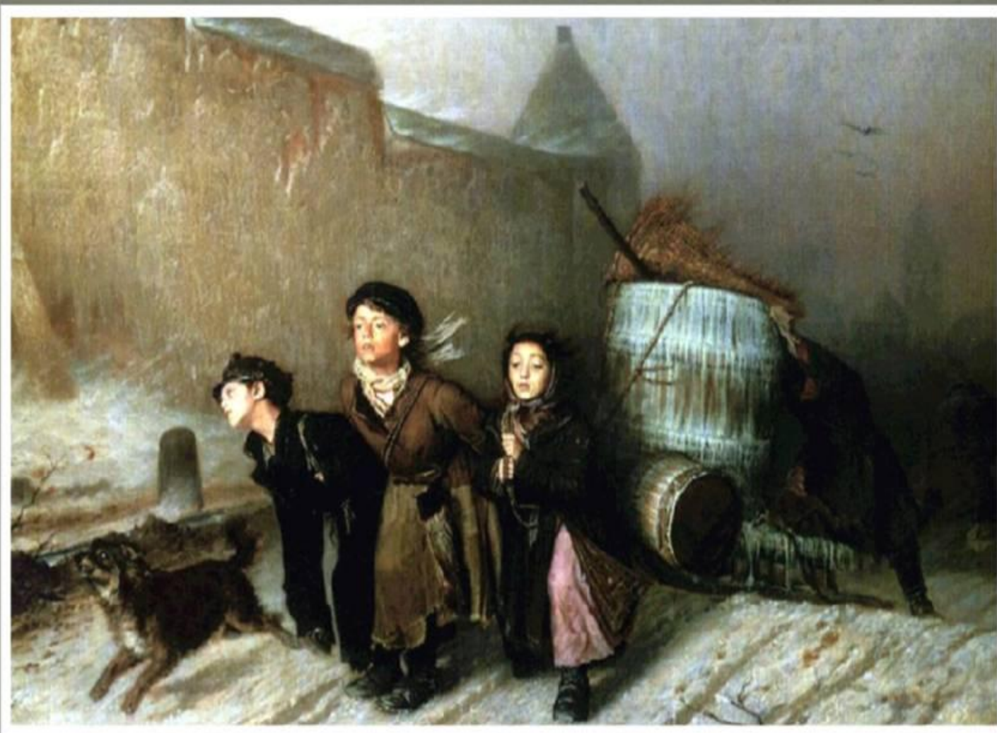
Тройка. Ученики мастеровые везут воду близ Москвы.