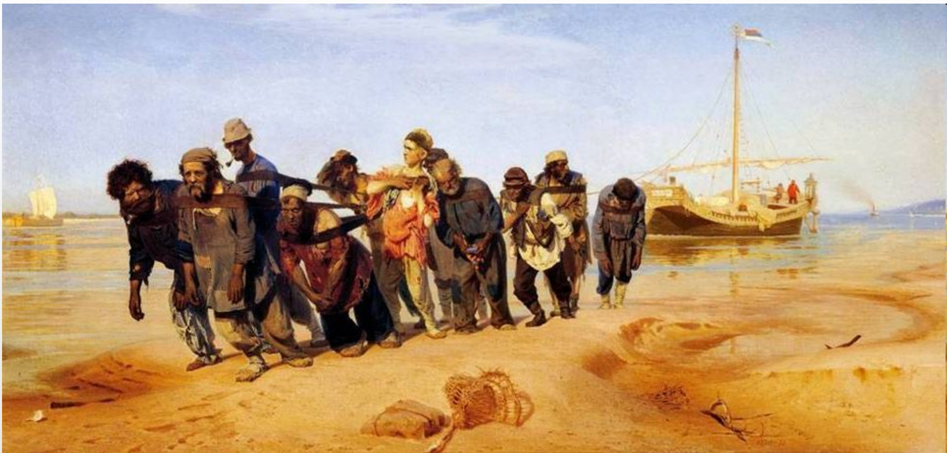
И.Репин «Бурлаки на Волге»