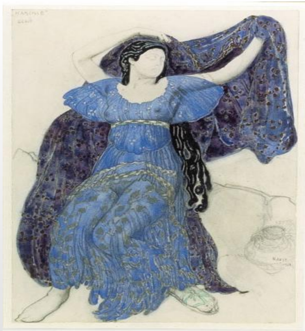
Л.Бакст Эскиз костюма нимфы