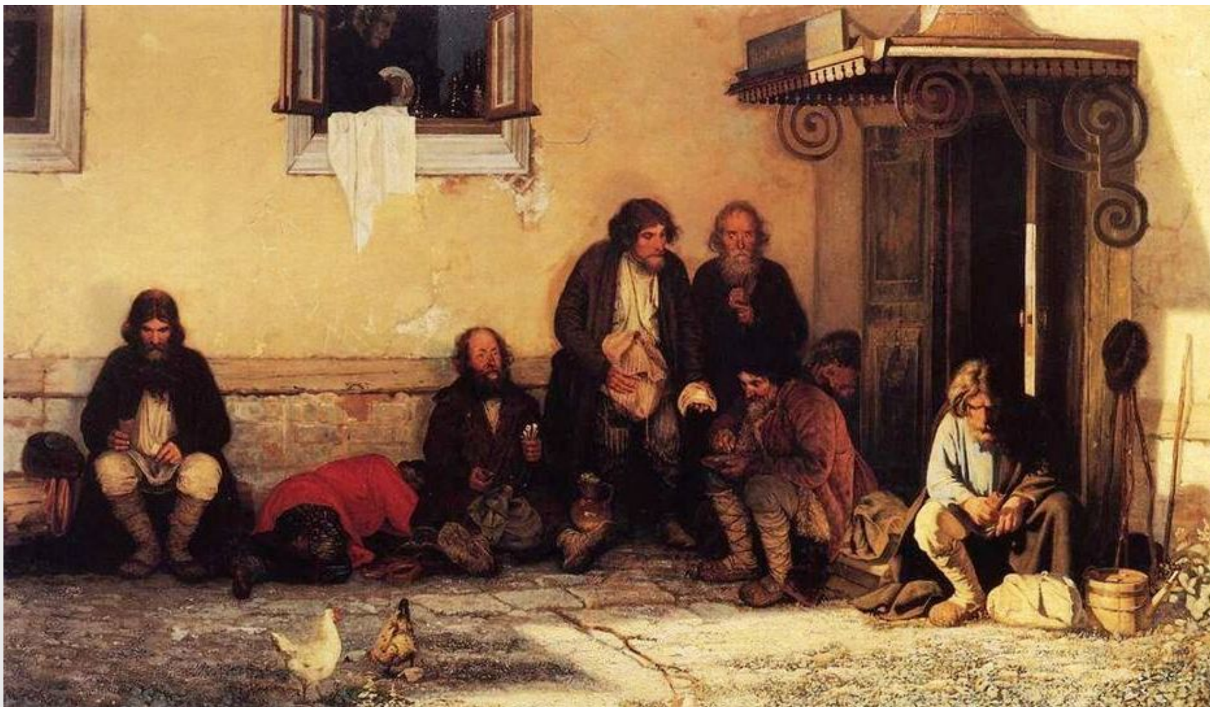
Г.Мясоедов «Земство обедает»