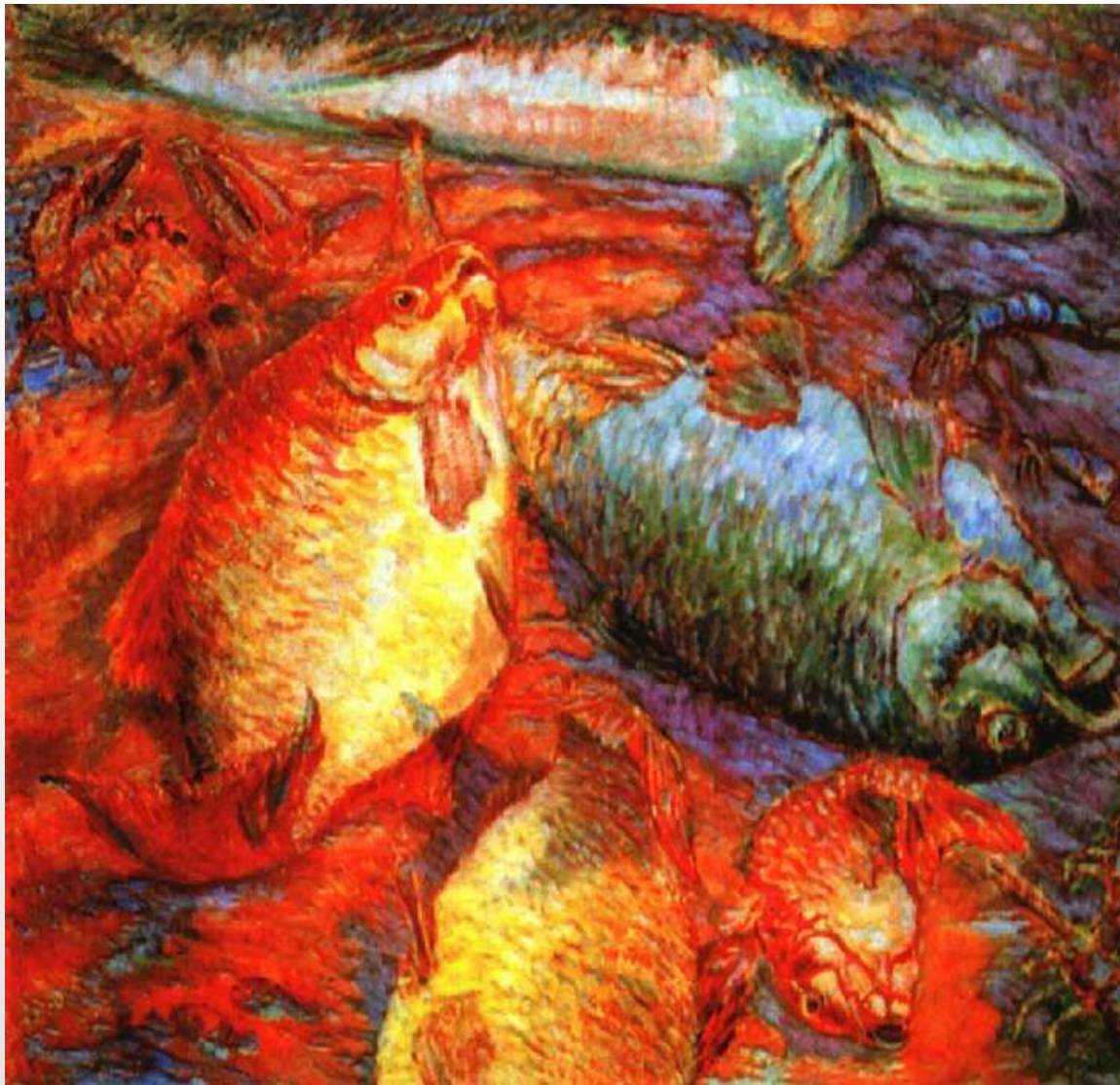
М.Ларионов «Рыбы при закате»