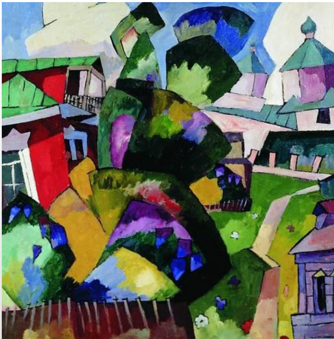
А.Лентулов «Деревянная церковь»