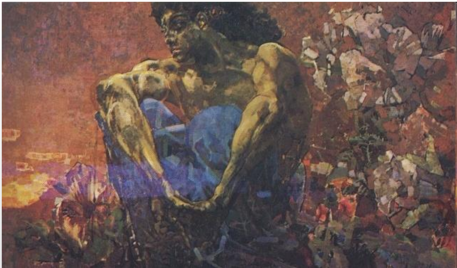
М.Врубель «Демон сидящий»