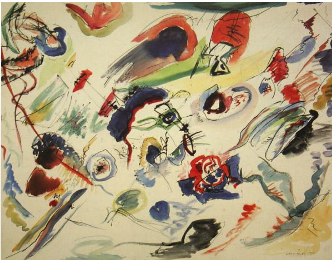
В.Кандинский «Первая абстрактная акварель»