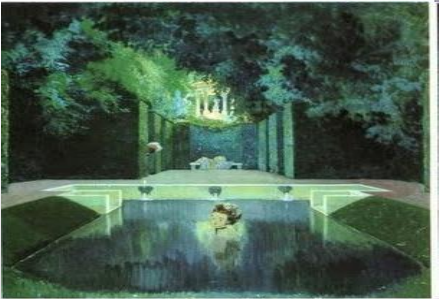
А.Бенуа «Купальня маркизы»