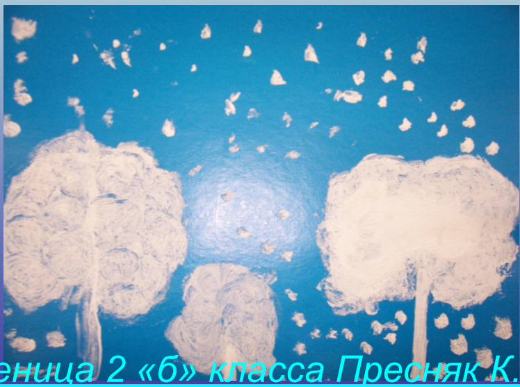
Ученица 2 «б» класса Пресняк К.