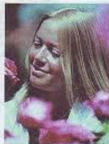
Рис. 117. Представители негроидной, монголоидной и европеоидной рас