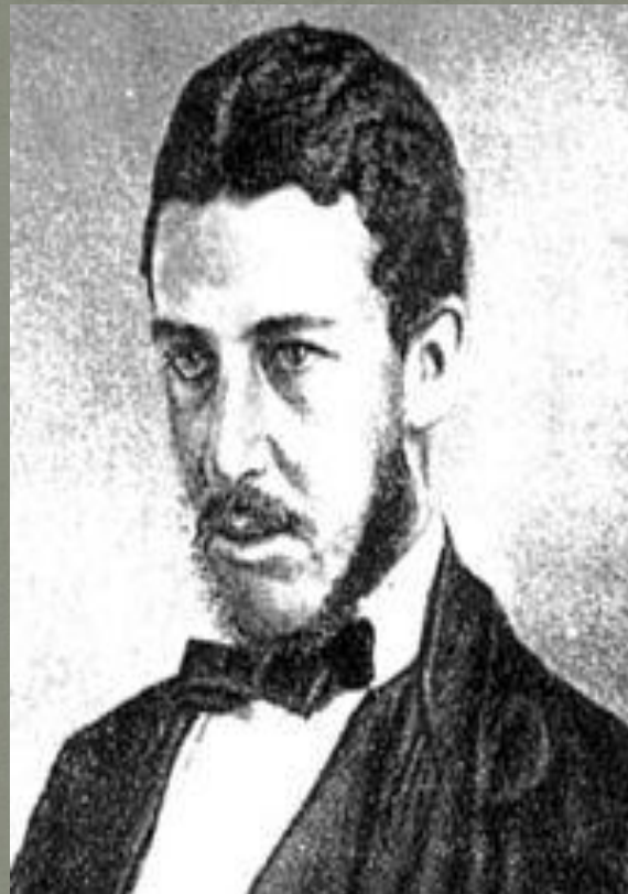
Уильям Стэнли Джевонс