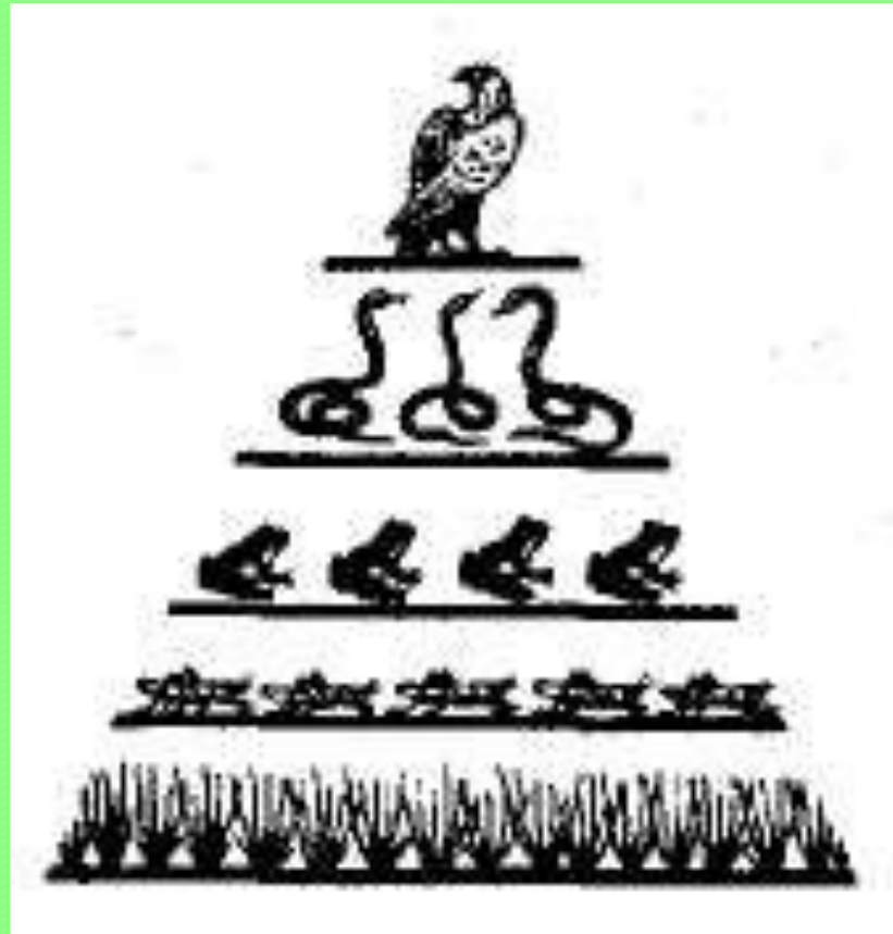
Упрощенная экологическая пирамида.