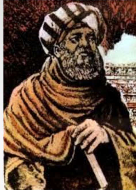
Сабита ибн Курра