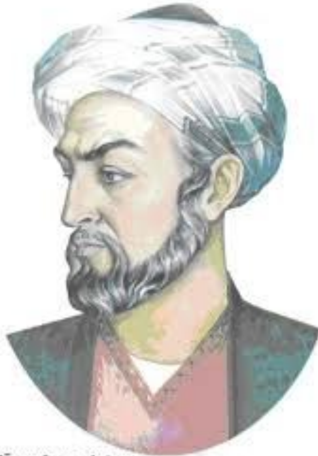
Абуали Сино - Авиценна