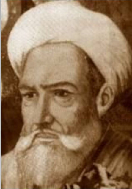
Хунайн ибн Исхак