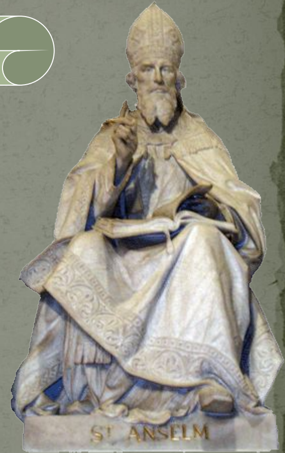
Ансельм Кентерберийский. «Монологион».

Некоторые братья часто и настойчиво просили меня написать для них, как некий образец размышления кое-что из того, что я высказывал им простыми словами в [наших] разговорах, о том, как следует размышлять о сущности Бога и других вещах, относящихся к размышлению такого рода. Притом они, <...> заказали мне такую форму этой письменной медитации, чтобы в последней совершенно ничто не принималось как доказанное на основании ссылки на авторитет Писания, но чтобы всё утверждаемое в выводе из отдельных исследований строго последовательно вытекало из расуждения и было явственным образом очевидно истинным.