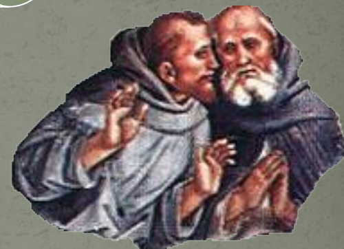
Гаунилон из Мармутье. «В защиту глупца».