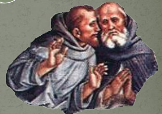
Гаунилон из Мармутье. «В защиту глупца».