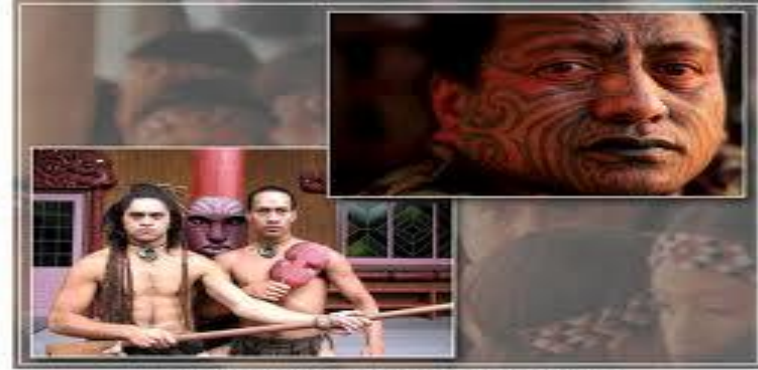
Маори - представители коренного населения Новой Зеландии.

Основное ядро – англоавстралийцы. Значительная доля иммиграции (даёт до 20 % прироста населения)