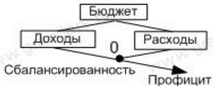
Рис. 31. Механизм балансировки госбюджета