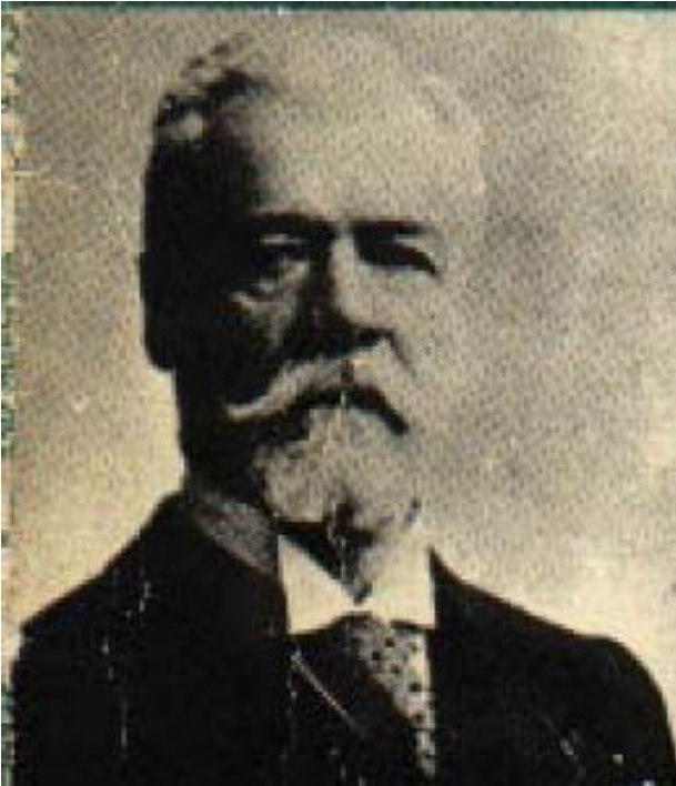
Анри Файоль (1841—1925)