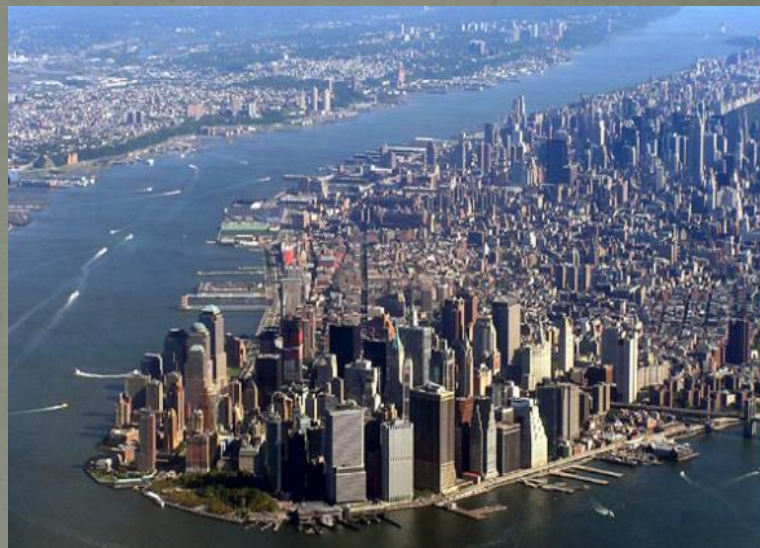
Остров в Манхеттене