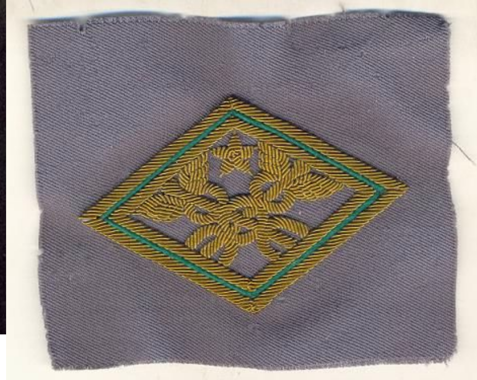
□ The sign of a sample of the 1972