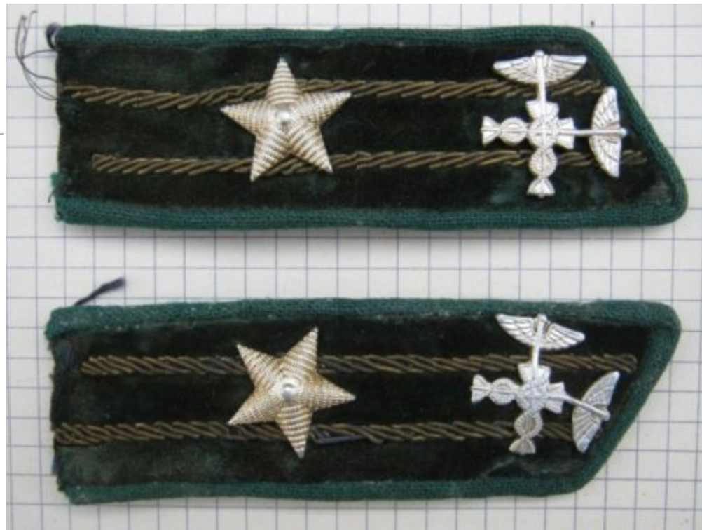
□ The customs buttonholes of a sample of 1972