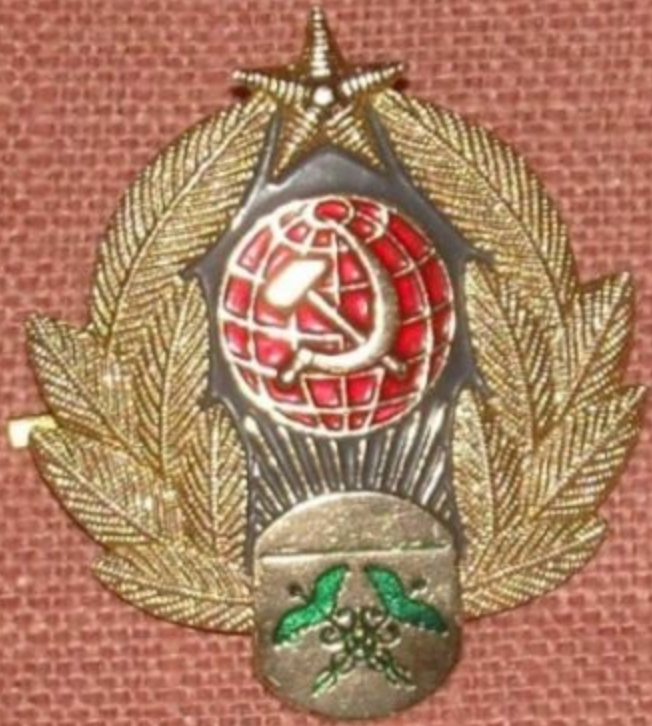
The cockarde of a sample of 1972