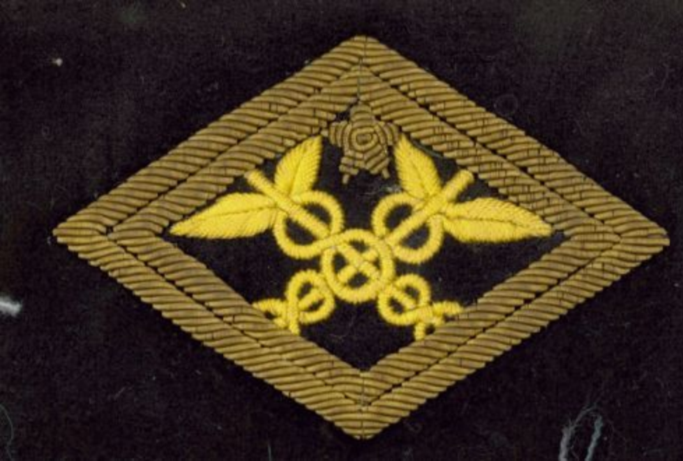
Signs of the Soviet customs service Sample of the 1952