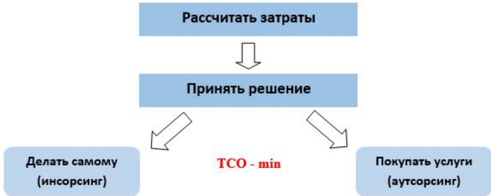
Схема принятий решения “Make or Buy” в логистике