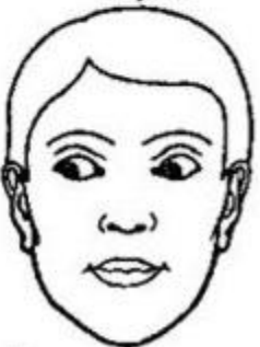
Чувства и телесные ощущения