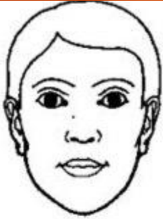
Визуализация (лишенная фокуса)