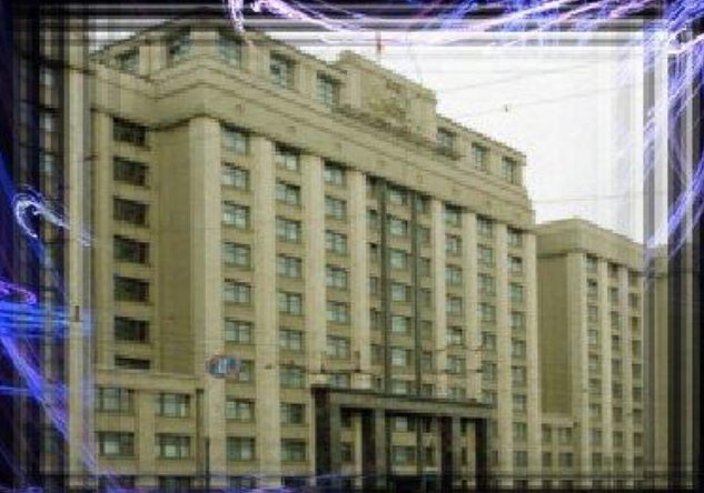
Здание Федерального собрания Российской Федерации