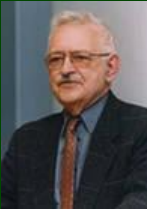
И. Валлерстайн (1930)