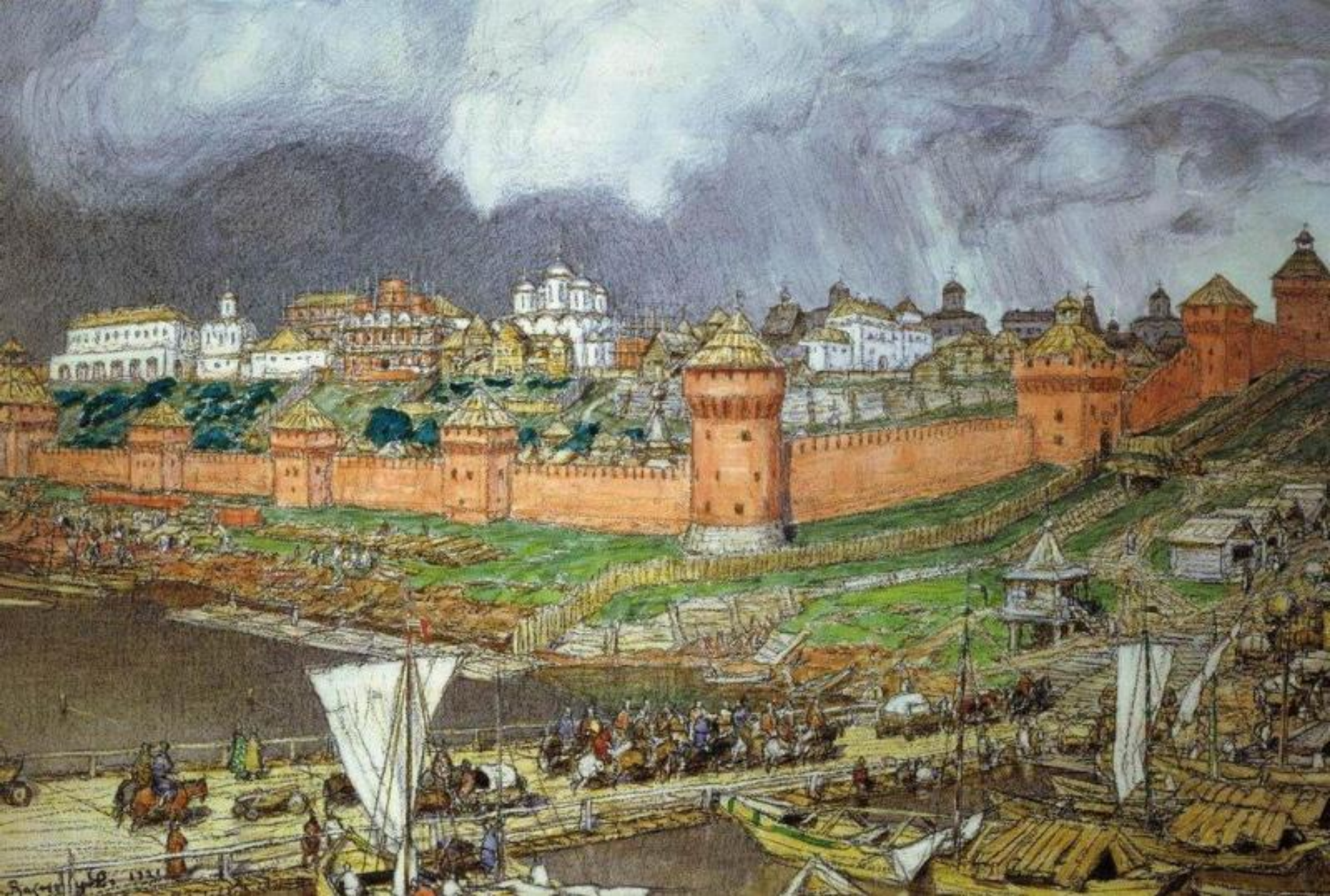
Васнецов Аполлинарий Михайлович (1856-1933): Московский Кремль при Иване III