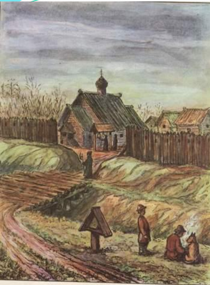
Древняя Тверь. Острог – ограждение посада.

Тверские князья и бояре стали переходить на службу к Ивану III. В 1485 г. Михаил послал письмо в Литву, но гонца перехватили люди Ивана III.