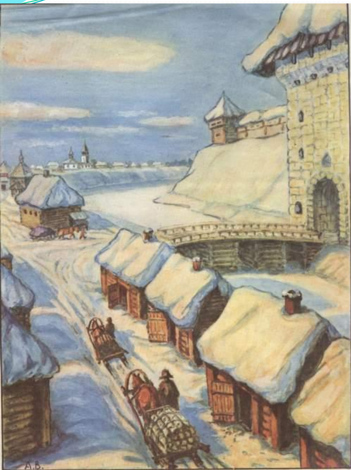
Владимирские ворота древней Твери.

Освобождение из-под власти Орды позволило Ивану III приступить к ликвидации Тверского княжества.