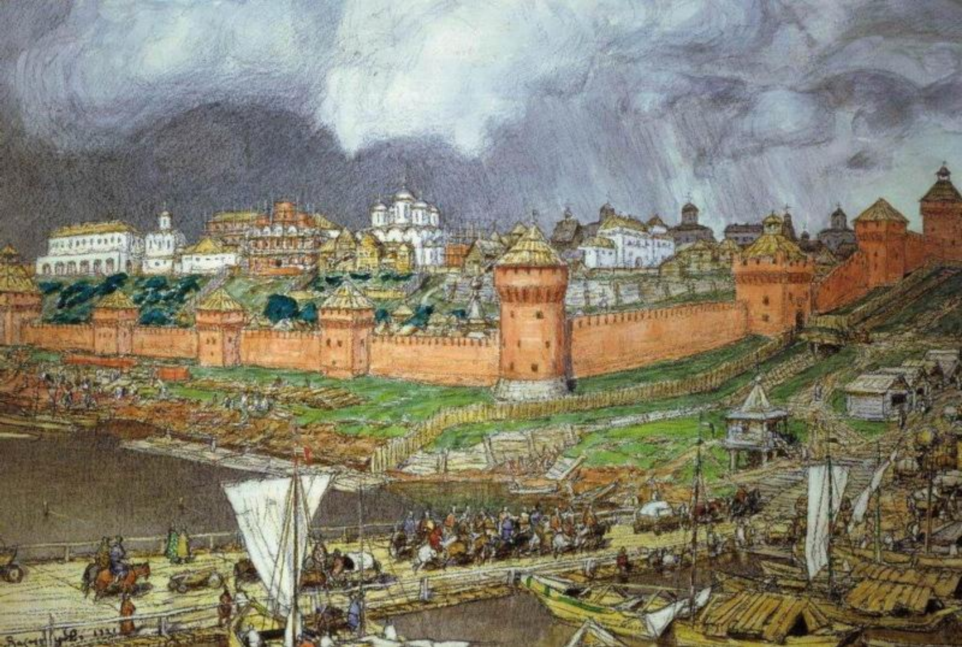
Васнецов Аполлинарий Михайлович (1856-1933): Московский Кремль при Иване III