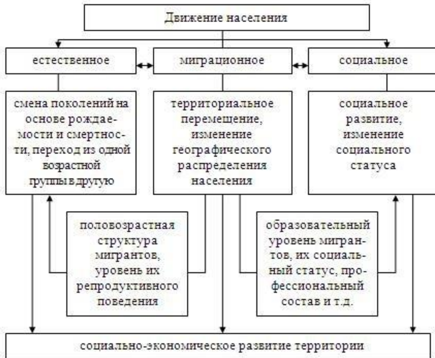
Рис. 1.4 - Взаимосвязь видов движения населения и их влияние на развитие территории