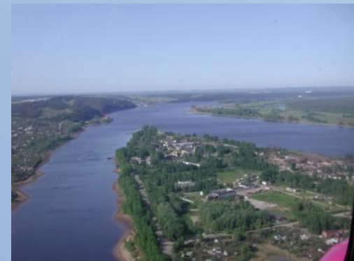
Место слияния Волги и Камы