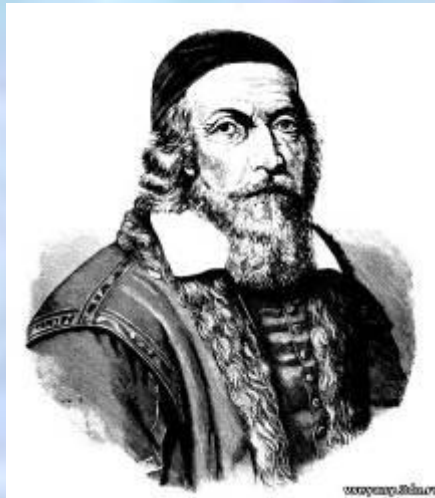
Ян Амос Каменский

«Считай несчастным тот день или тот час, в котором ты не усвоил ничего, ничего не прибавил к своему образованию»