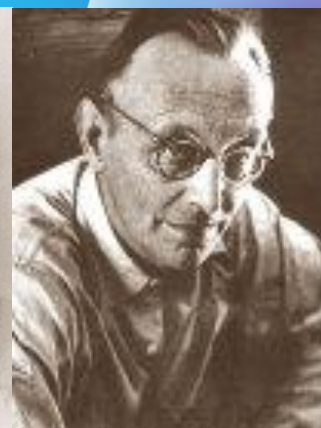
Рихард Вагнер 1813-1883