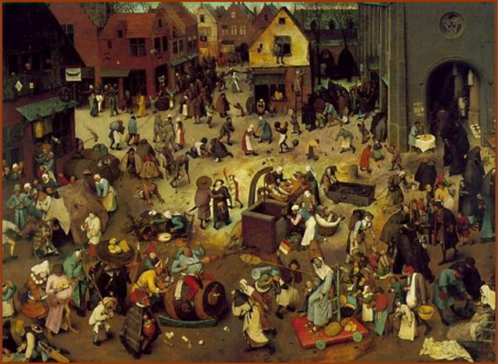
Питер Брейгель Старший «Встреча поста с масленицей»