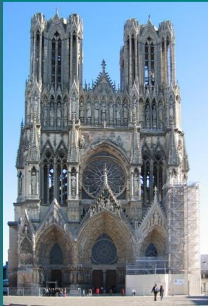
Готический средневековой собор