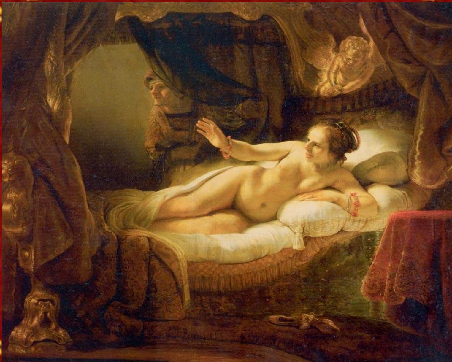
"Даная" 1636 Эрмитаж, Санкт-Петербург