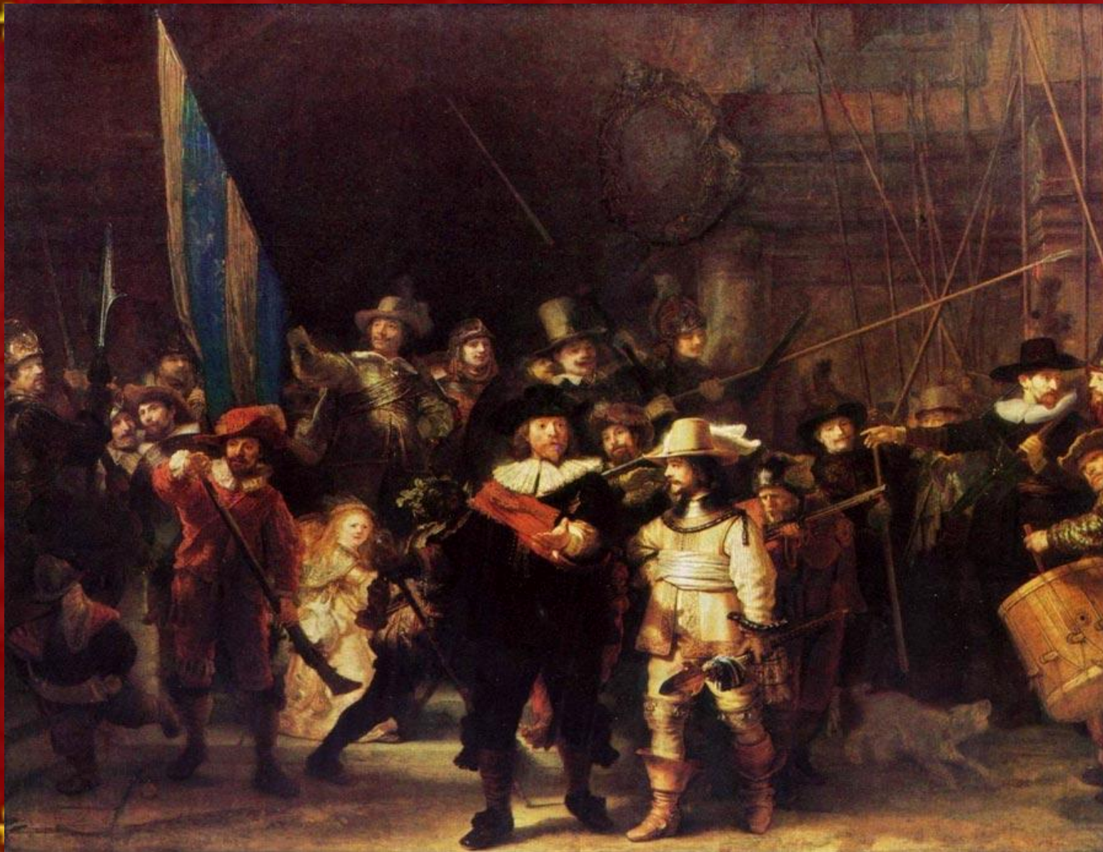
"Ночной дозор" 1642 Рейкс музей, Амстердам