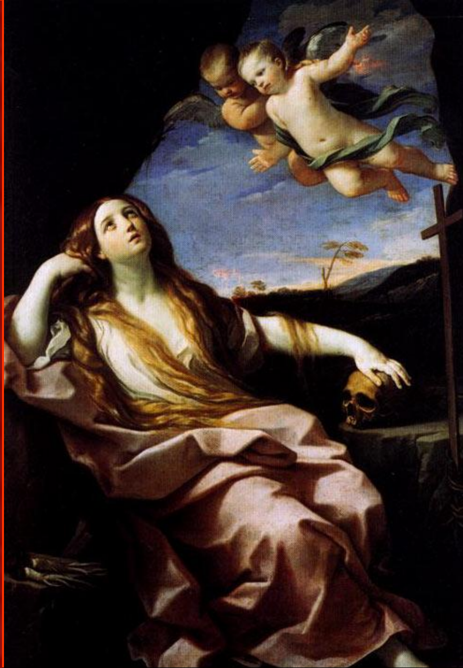
Мария Магдалена Ок. 1600