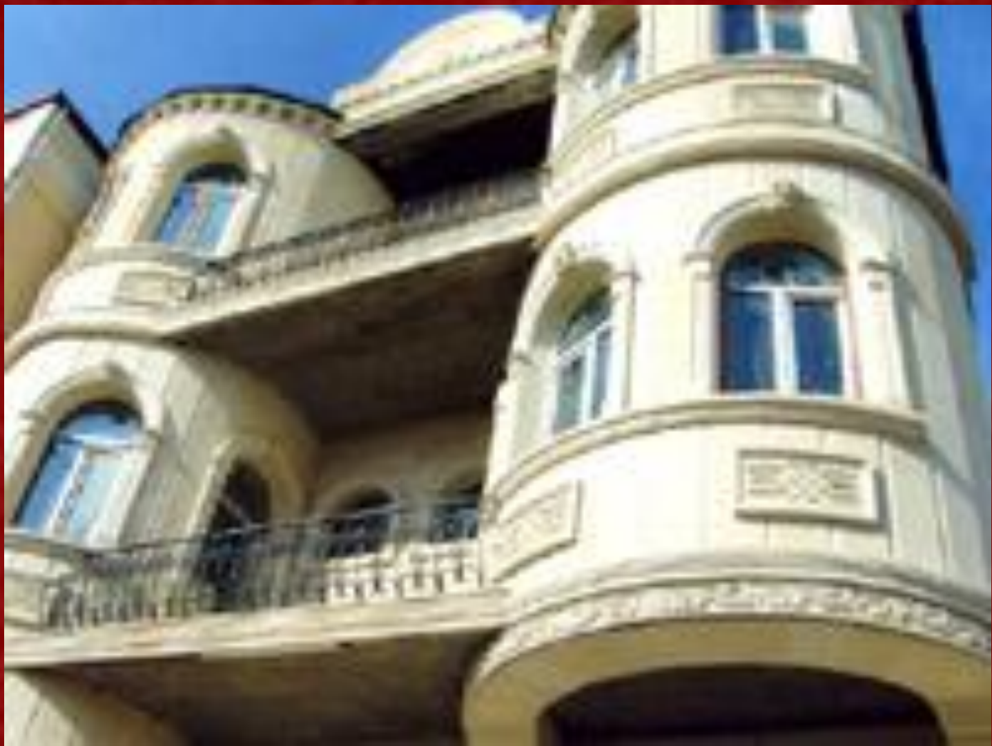
Лепнина на зданиях