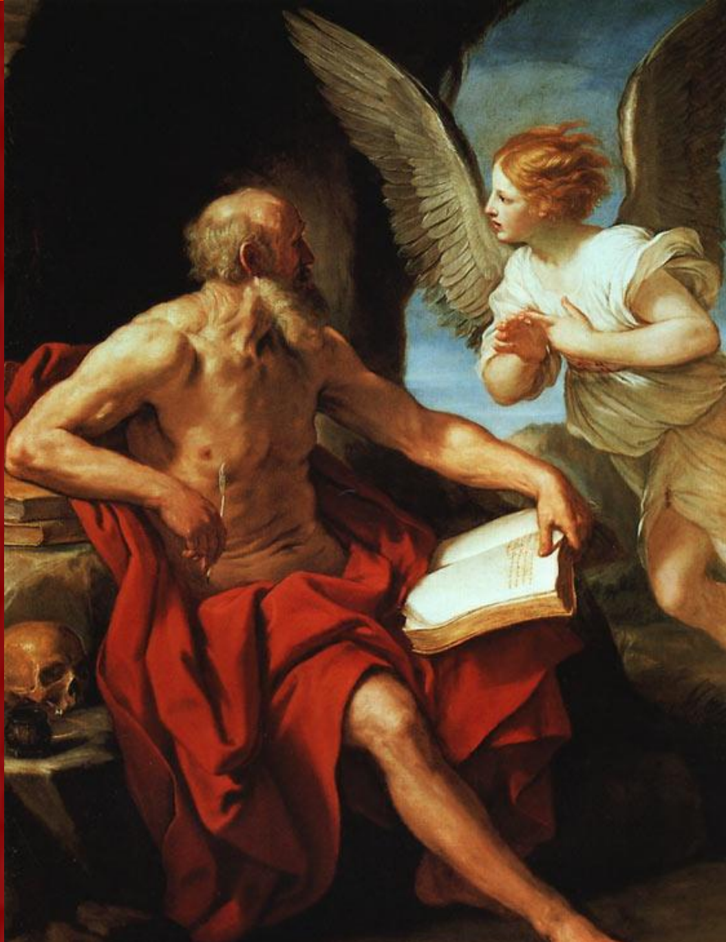
Св. Иероним и ангел 1635