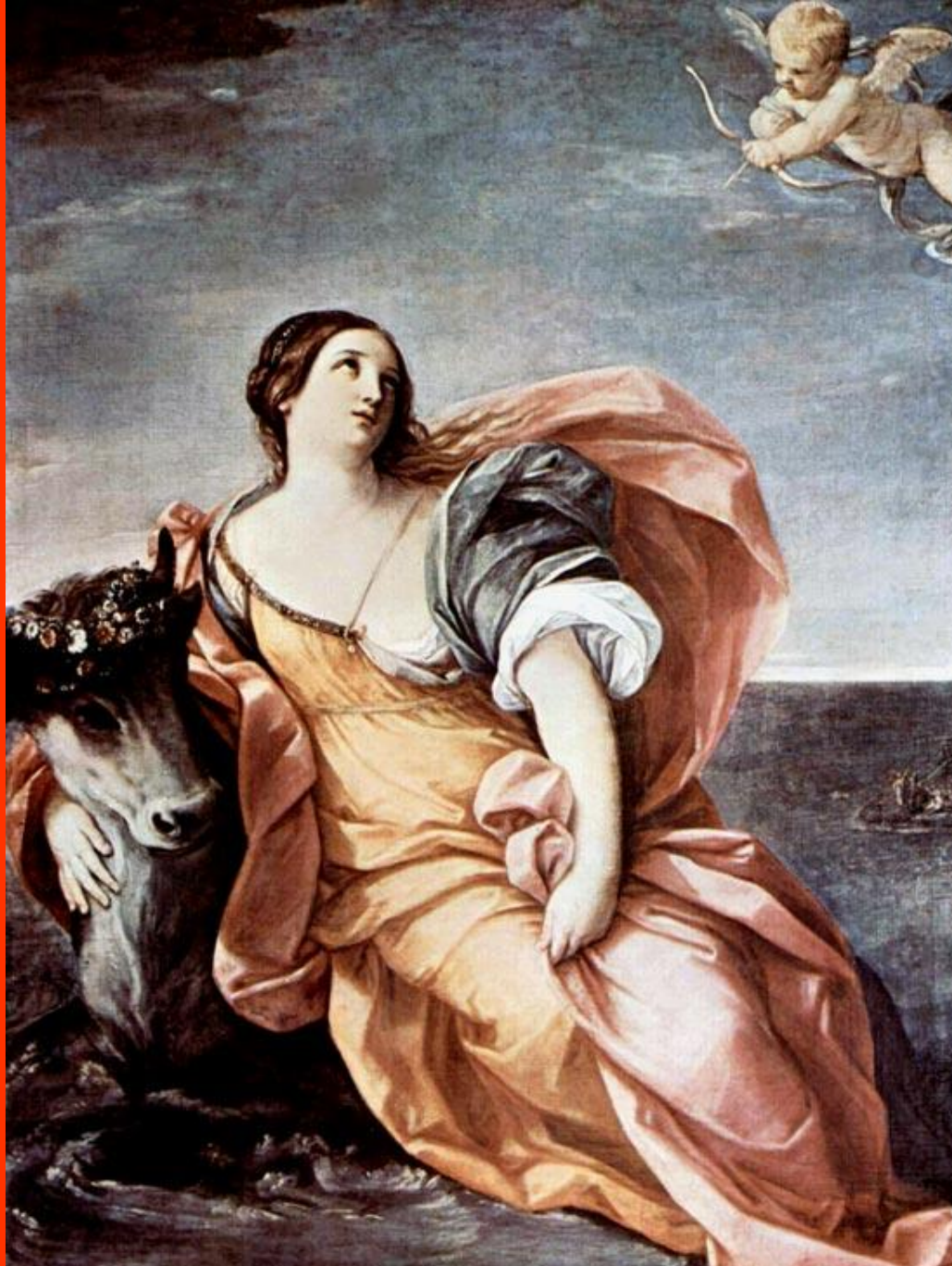
Похищение Европы 1630-1640