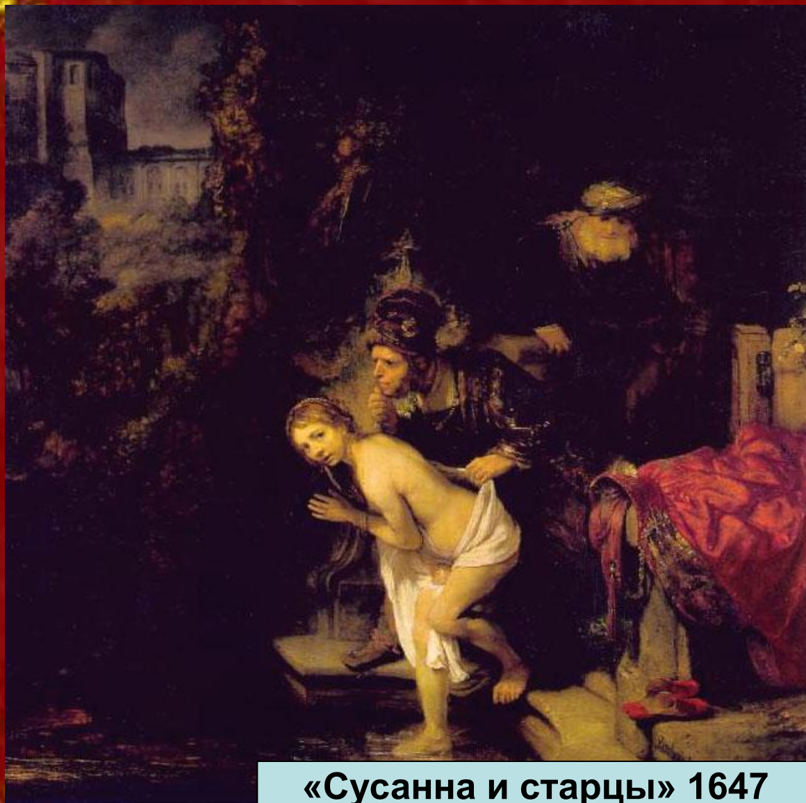
«Сусанна и старцы» 1647

Искусство барокко сложилось и расцвело в Италии, где работали крупнейший архитектор и скульптор Л. Бернини, живописец, глава демократического реализма Караваджо, последователи академизма братья Карраччи и др.