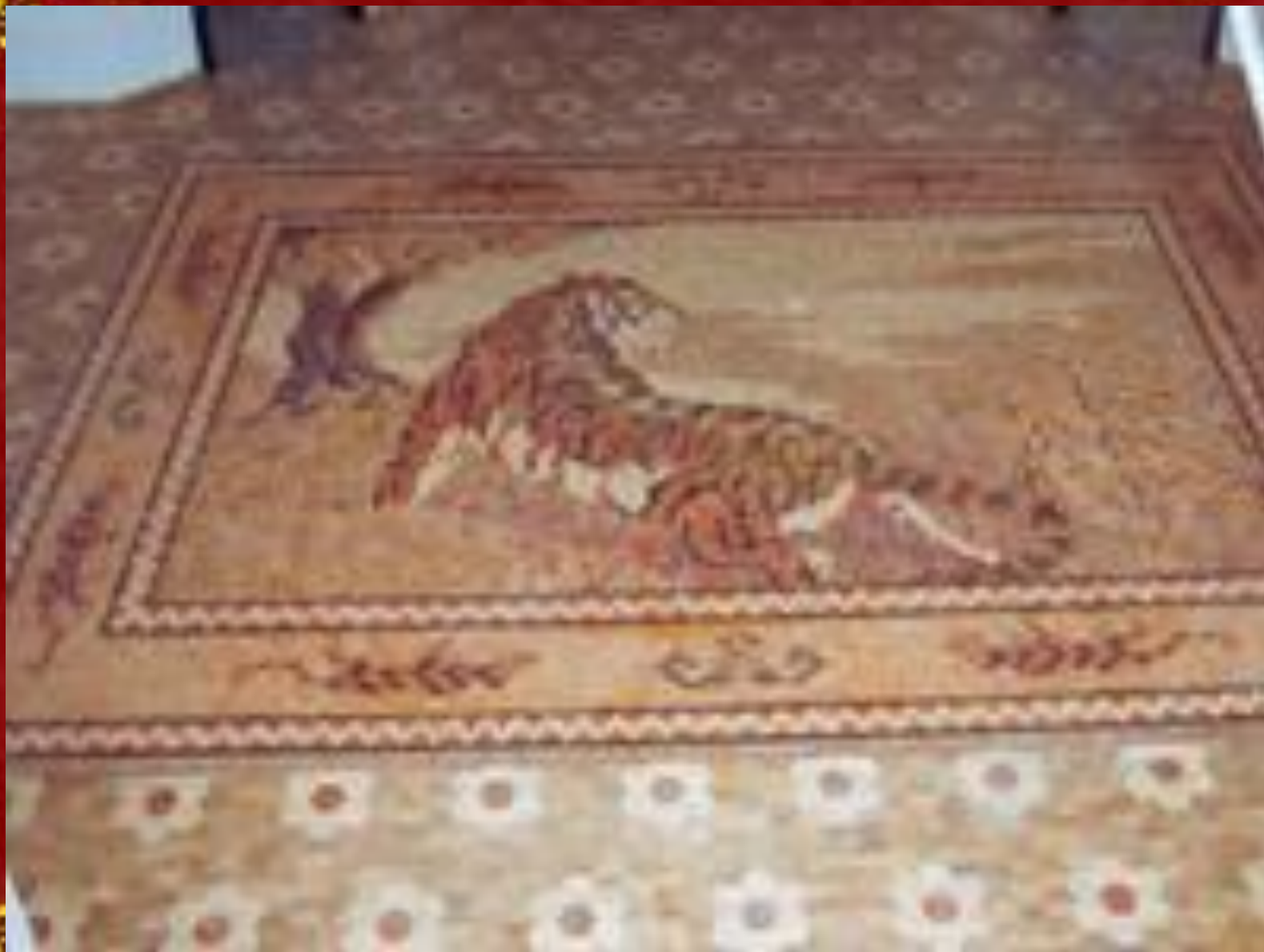
Паркет в стиле барокко