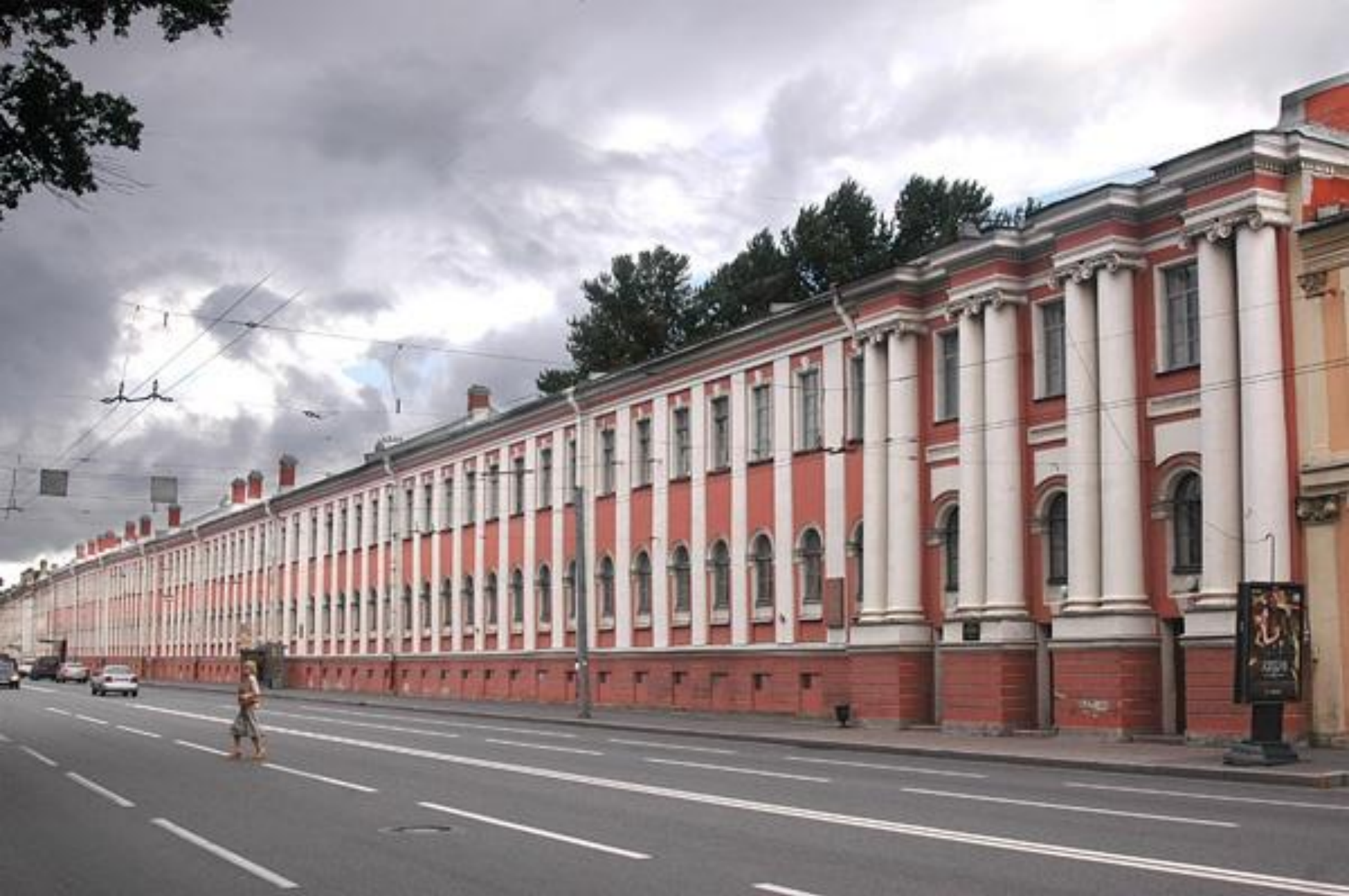
Архитекторы: Трезини Дж. Год постройки:1730-1740 Стиль: Барокко Здание Первого Кадетского корпуса