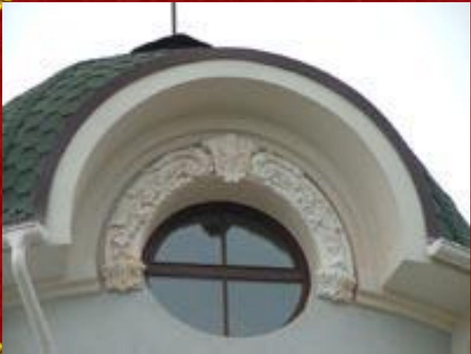
Лепнина на зданиях