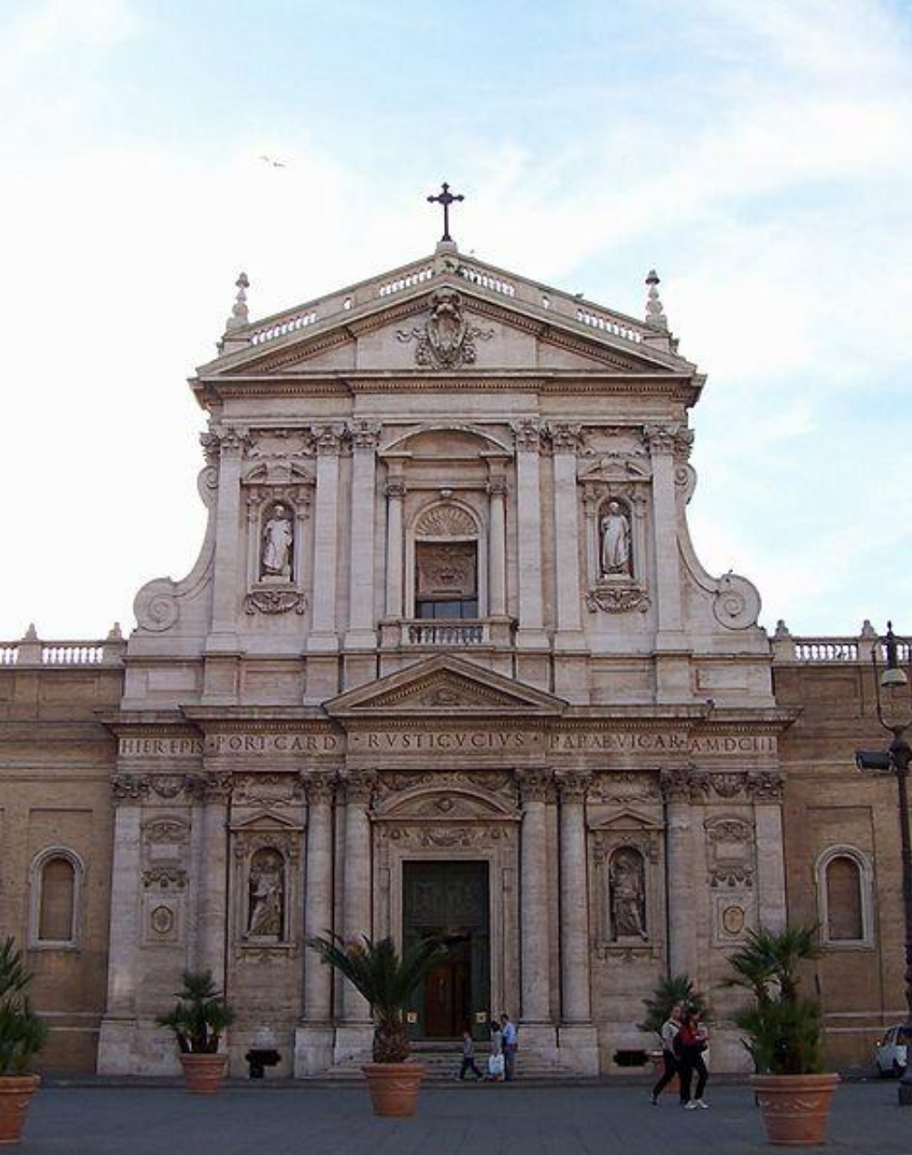
Карло Мадерна Церковь Святой Сусанны, Рим

Для архитектуры барокко (Л. Бернини, Ф. Борромини в Италии, Б. Ф. Растрелли в России) характерны пространственный размах, слитность, текучесть сложных, обычно криволинейных форм. Часто встречаются развернутые масштабные колоннады, изобилие скульптуры на фасадах и в интерьерах, волюты, большое число раскреповок, лучковые фасады с раскреповкой в середине, рустованные колонны и пилястры. Купола приобретают сложные формы, часто они многоярусны, как у собора Св. Петра в Риме.