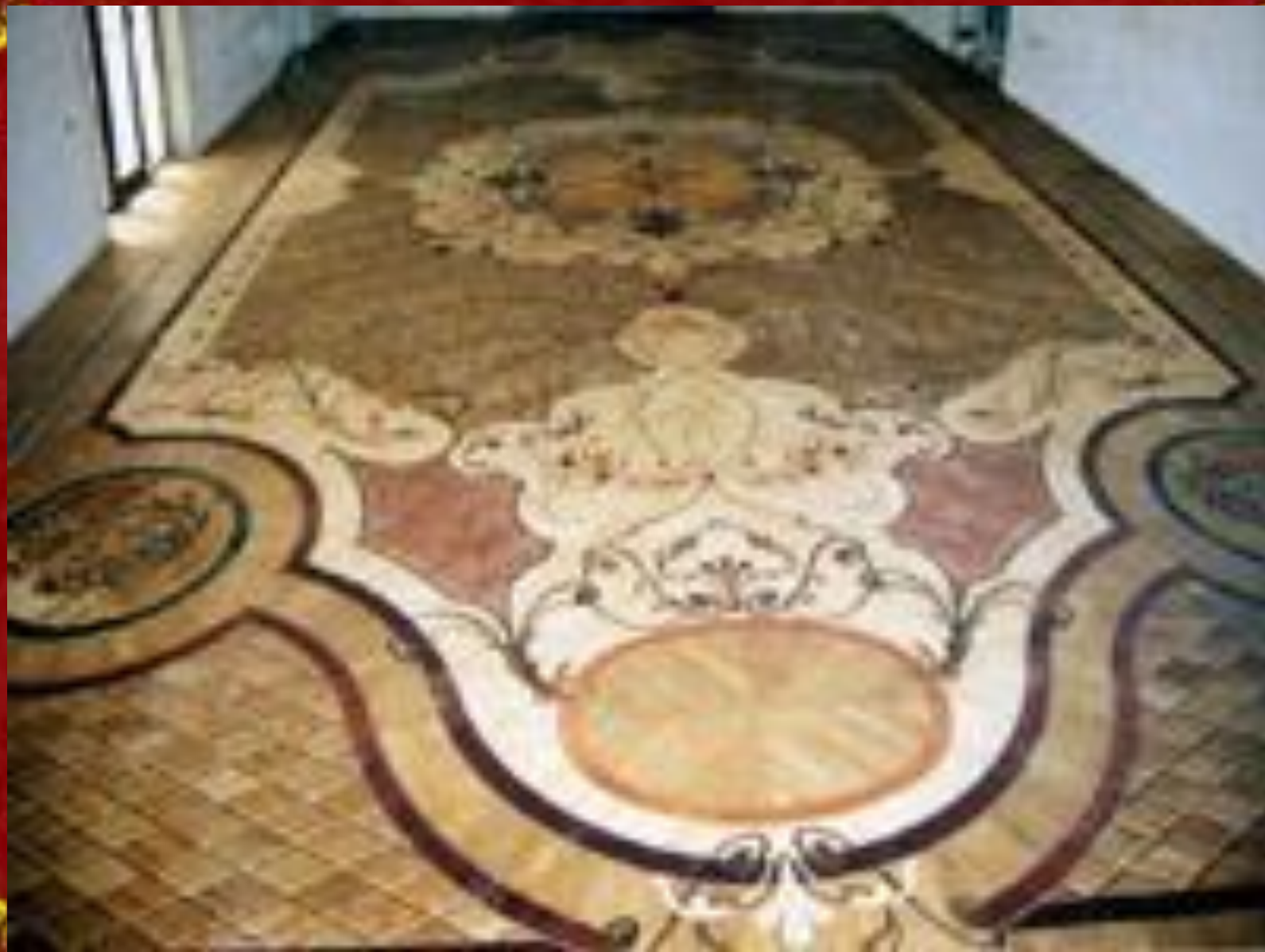
Паркет в стиле барокко