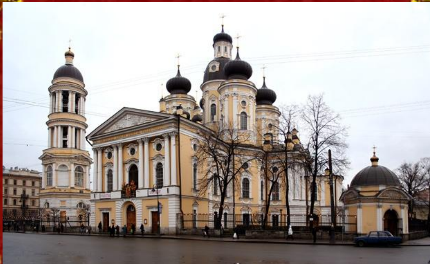
Собор Владимирской иконы Божией Матери с колокольней

Архитектор: Кваренги Д. Год постройки: 1761-1769, 1783 Стиль: Барокко