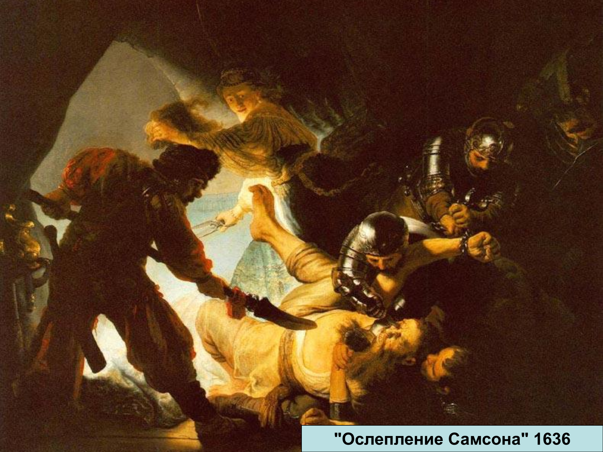
"Ослепление Самсона" 1636