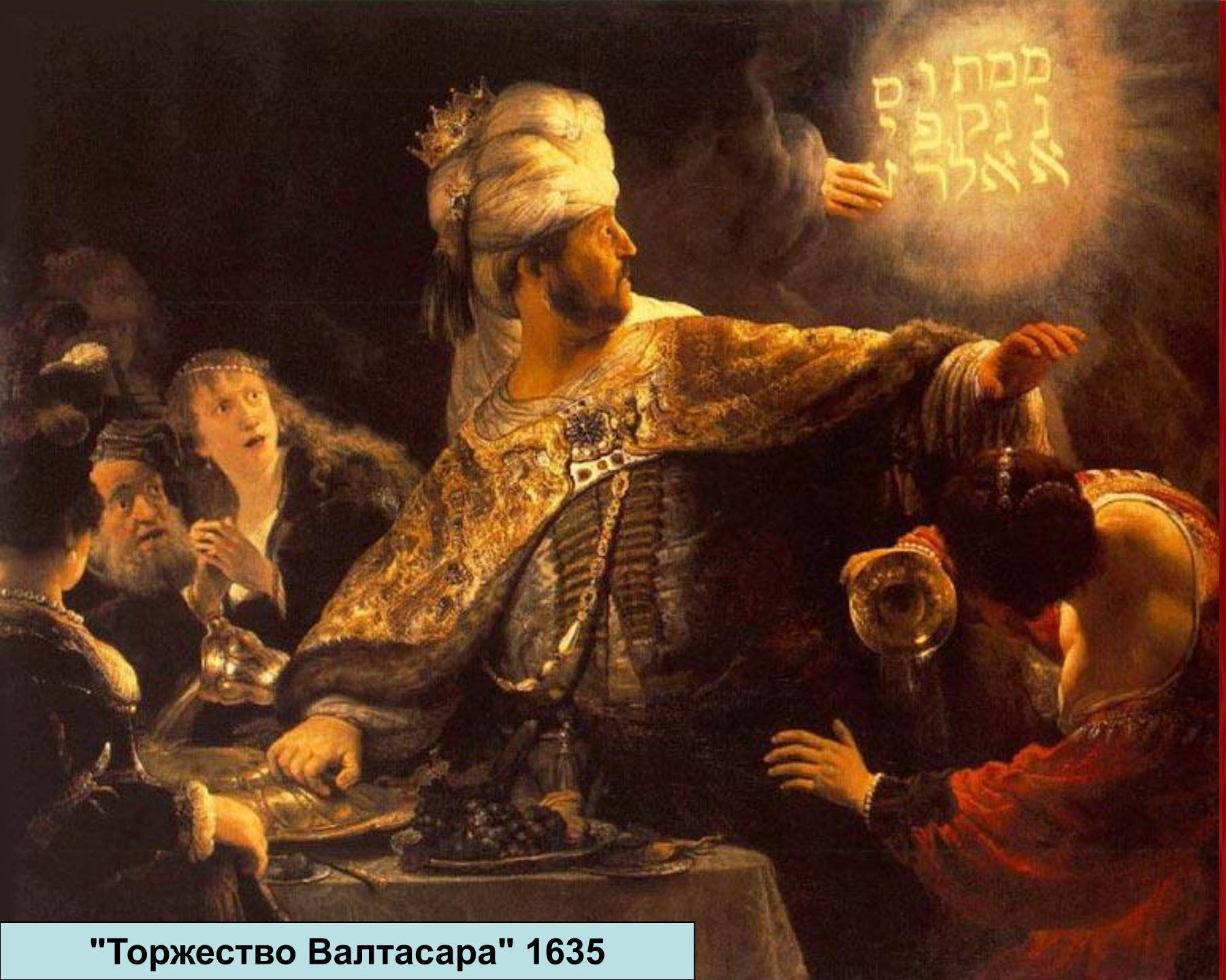
"Торжество Валтасара" 1635