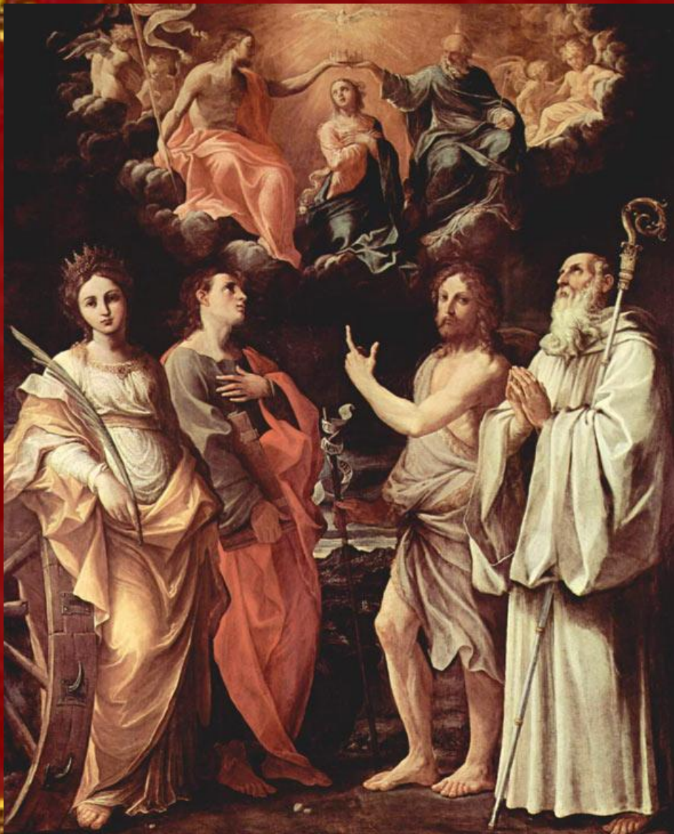
Коронование девы Марии, 1595-1598

У истоков традиции Барокко искусства в живописи стоят два великих итальянских художника - Караваджо и Аннибале Карраччи, создавшие самые значительные работы в последнее десятилетие 16 века - первое десятилетие 17 века. Для итальянской живописи конца 16 века характерны неестественность и стилевая неопределённость. Караваджо и Карраччи своим искусством вернули ей цельность и