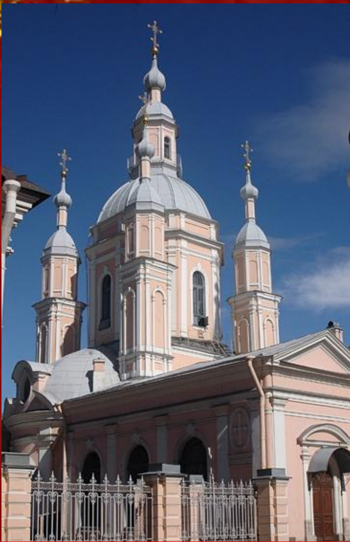
Собор св. Андрея Первозванного

Архитектор: Вист А. Ф. Год постройки: 1764-1768. Стиль: Барокко