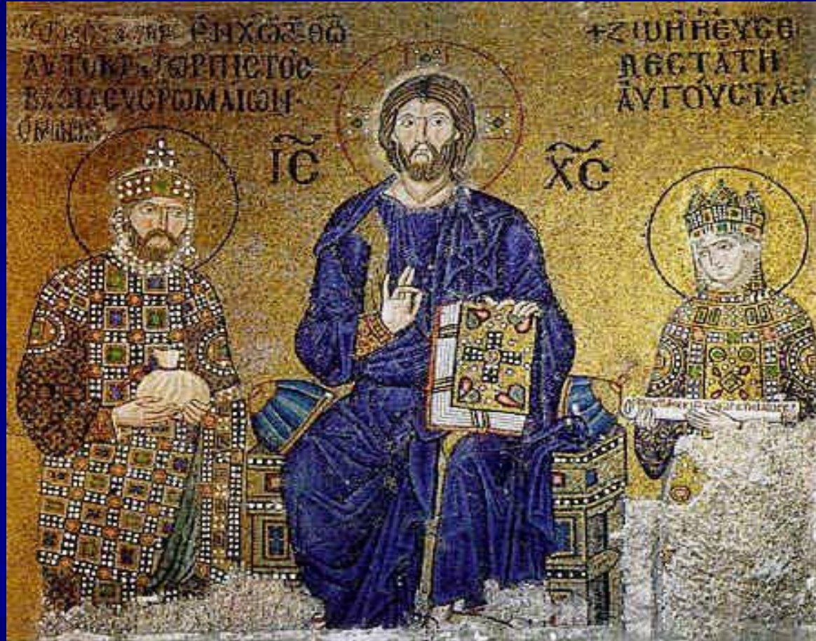
Приношение даров императором Константином IX Мономахом и императрицей Зоей