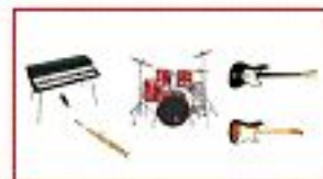
Джаз-рок фьюжн бэнд