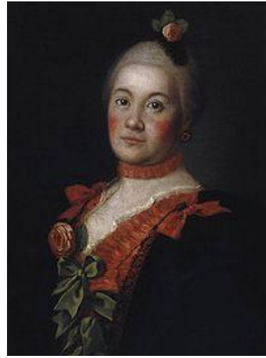
Портрет княгини Т. А.Трубецкой