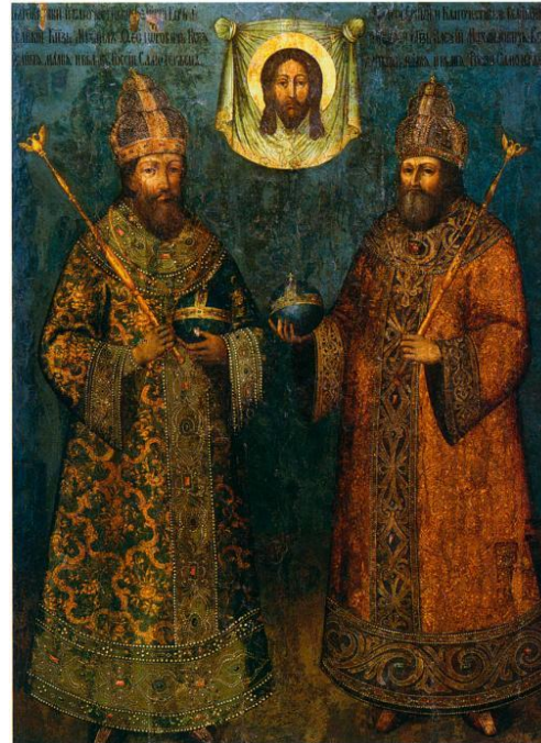
Царь Михаил Федорович и царь Алексей Михайлович, предстоящие перед образом Спаса Нерукотворного.