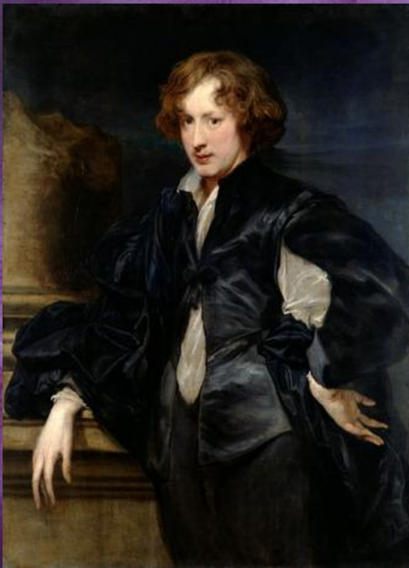
Антонис Ван Дейк. Автопортрет. Конец 1620-х — начало 1630 х гг. Государственный Эрмитаж, Санкт-Петербург