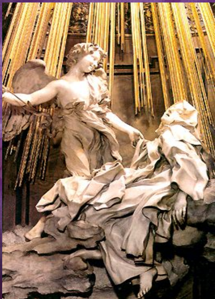
«Экстаз Святой Терезы»