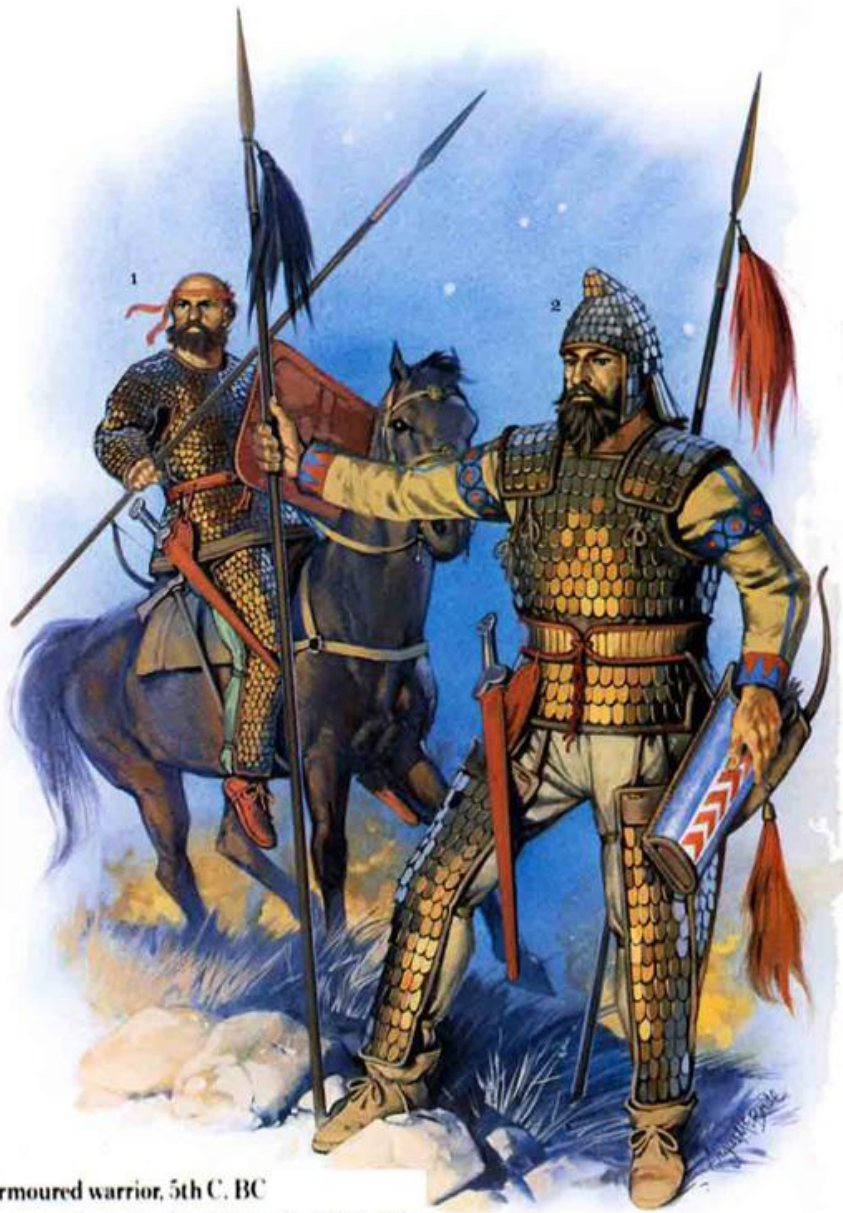
1: Armoured warrior, 5th C. BC