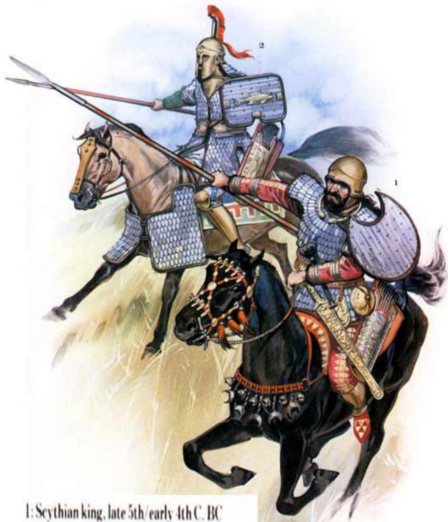
1: Scythian king, late 5th/early 4th C. BC