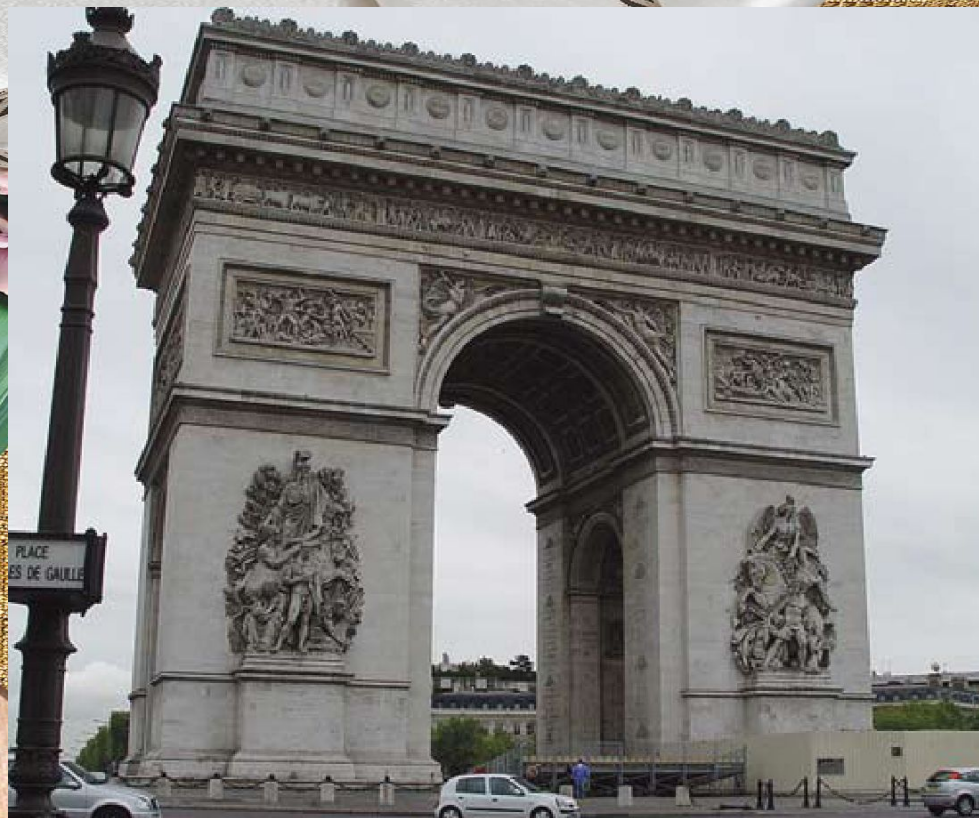
Триумфальная арка на Елисейских полях в Париже

По указу Наполеона I, который хотел обессмертить славу своей армии, построены Триумфальные ворота в Париже. На стенах арки выгравированы имена генералов, сражавшихся вместе с императором.