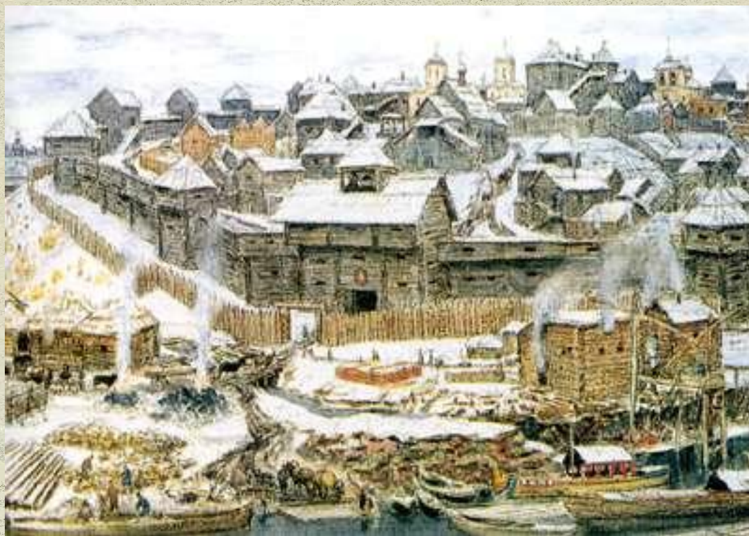
Московский Кремль при Иване Калите Акварель. А.М. Васнецов

Московский Кремль: символ Москвы и России. Это бывшая резиденция Русских царей и патриархов. Кремль содержит уникальную коллекцию исторических архитектурных и культурных предметов.