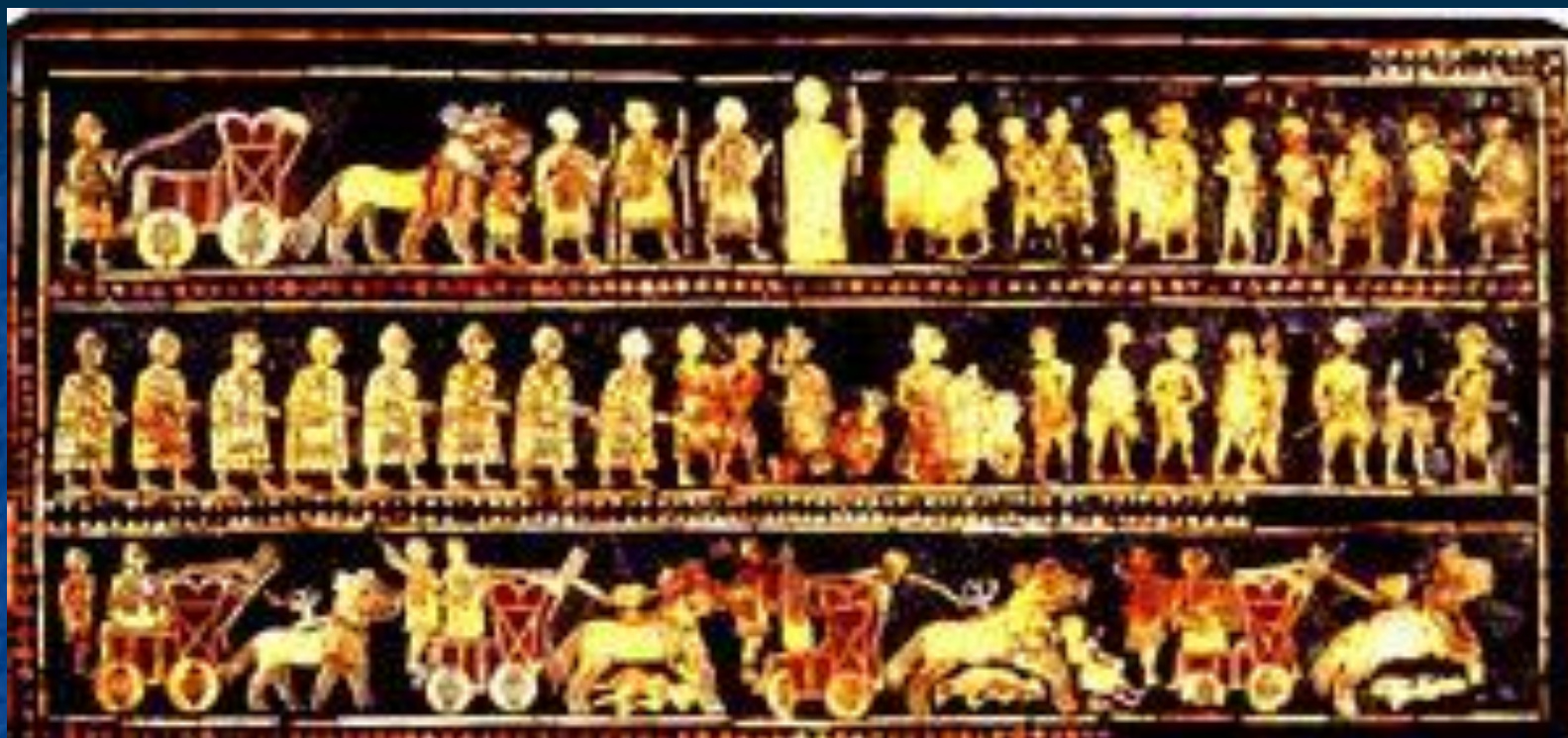
шкатулка «Штандарт Ура» (Лондон, Британский музей)