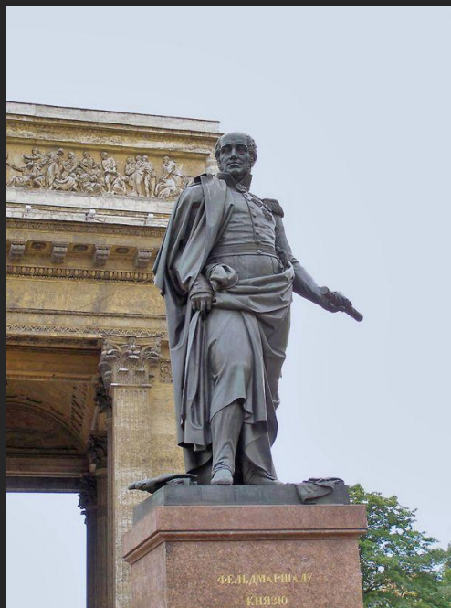
Б. Орловский, архитектор В. Стасов Памятник М.Б. Барклаю де Толли 1837