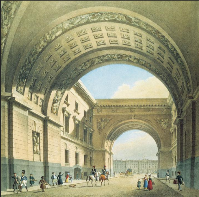
К. Бегров Вид на арку Главного штаба 1820