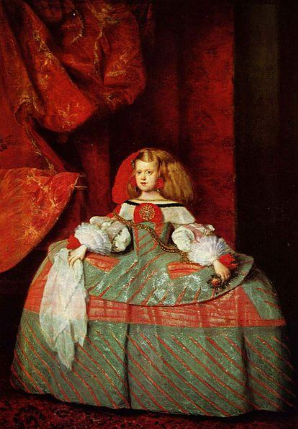
ДИЕГО ВЕЛАСКЕС «ИНФАНТА МАРГАРИТА АВСТРИЙСКАЯ», 1660 г.