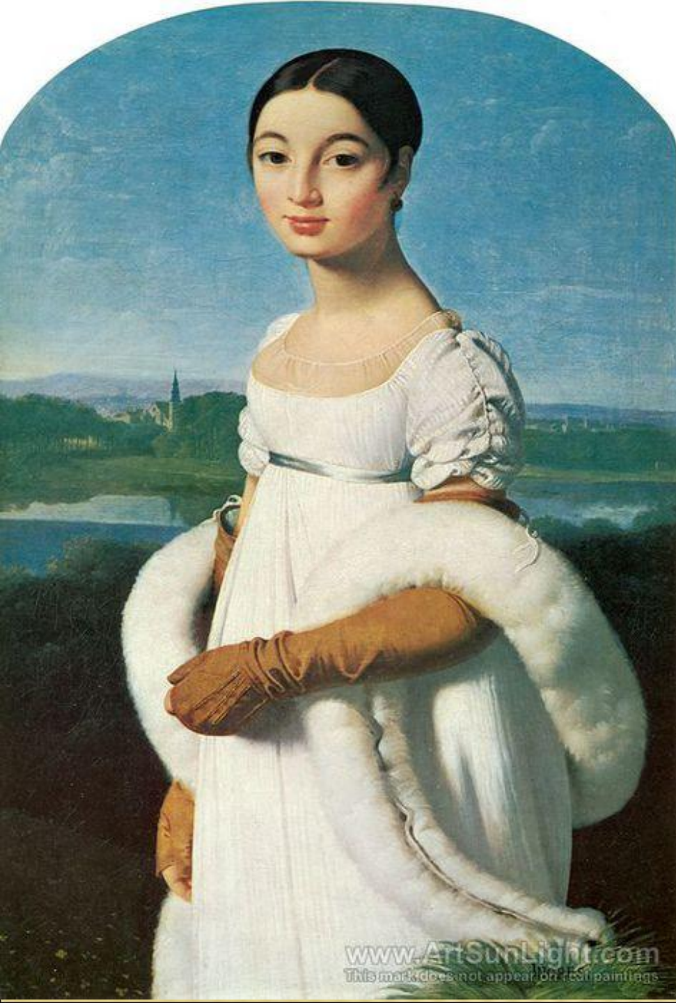
ЖАН ОГЮСТ ЭНГР «МАДМУАЗЕЛЬ РИВЬЕР»