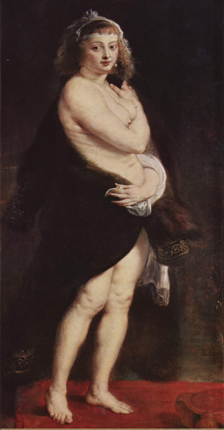
«ШУБКА», 1636 г., П. РУБЕНС