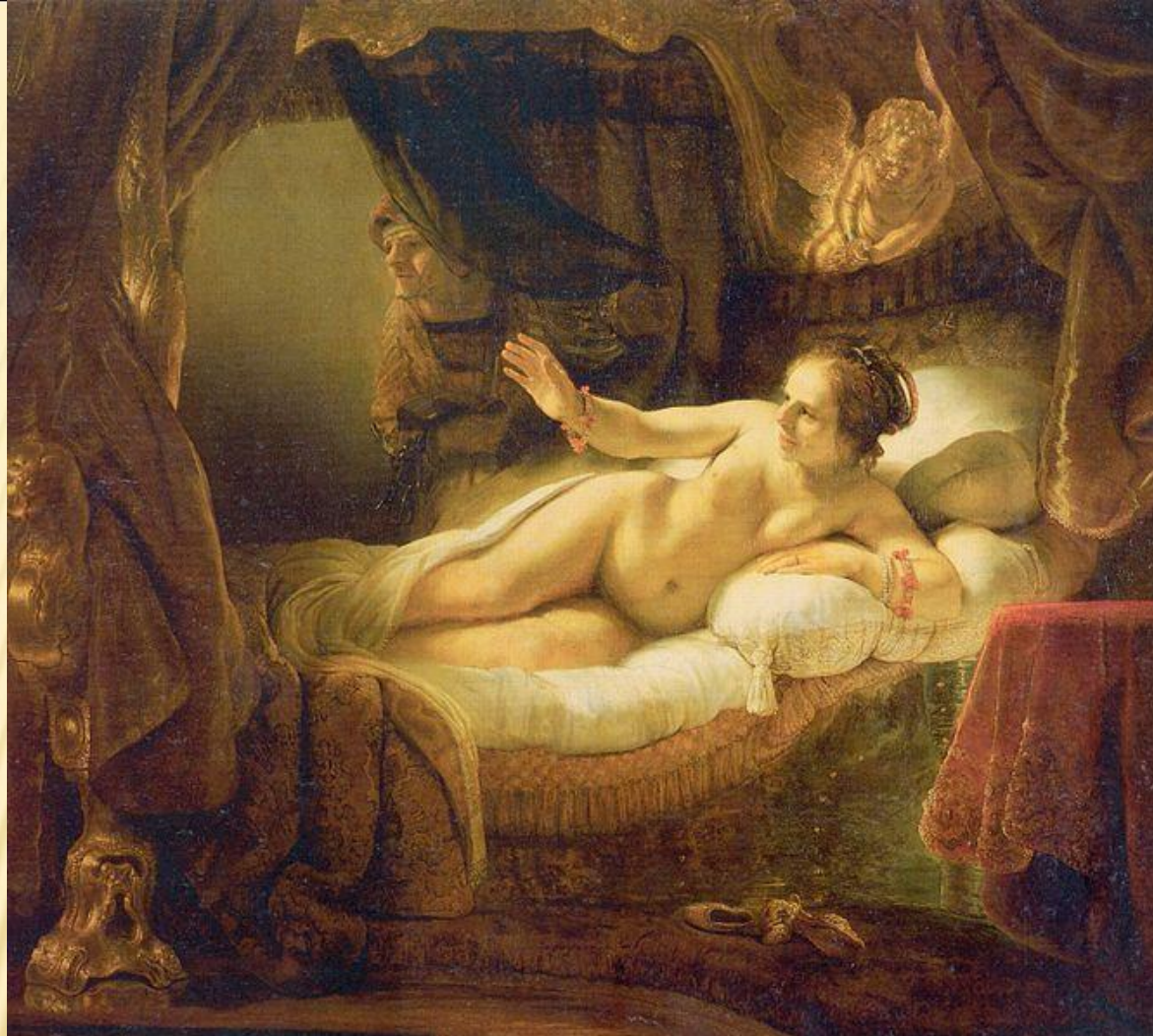
РЕМБРАНДТ «ДАНАЯ», 1636 г.