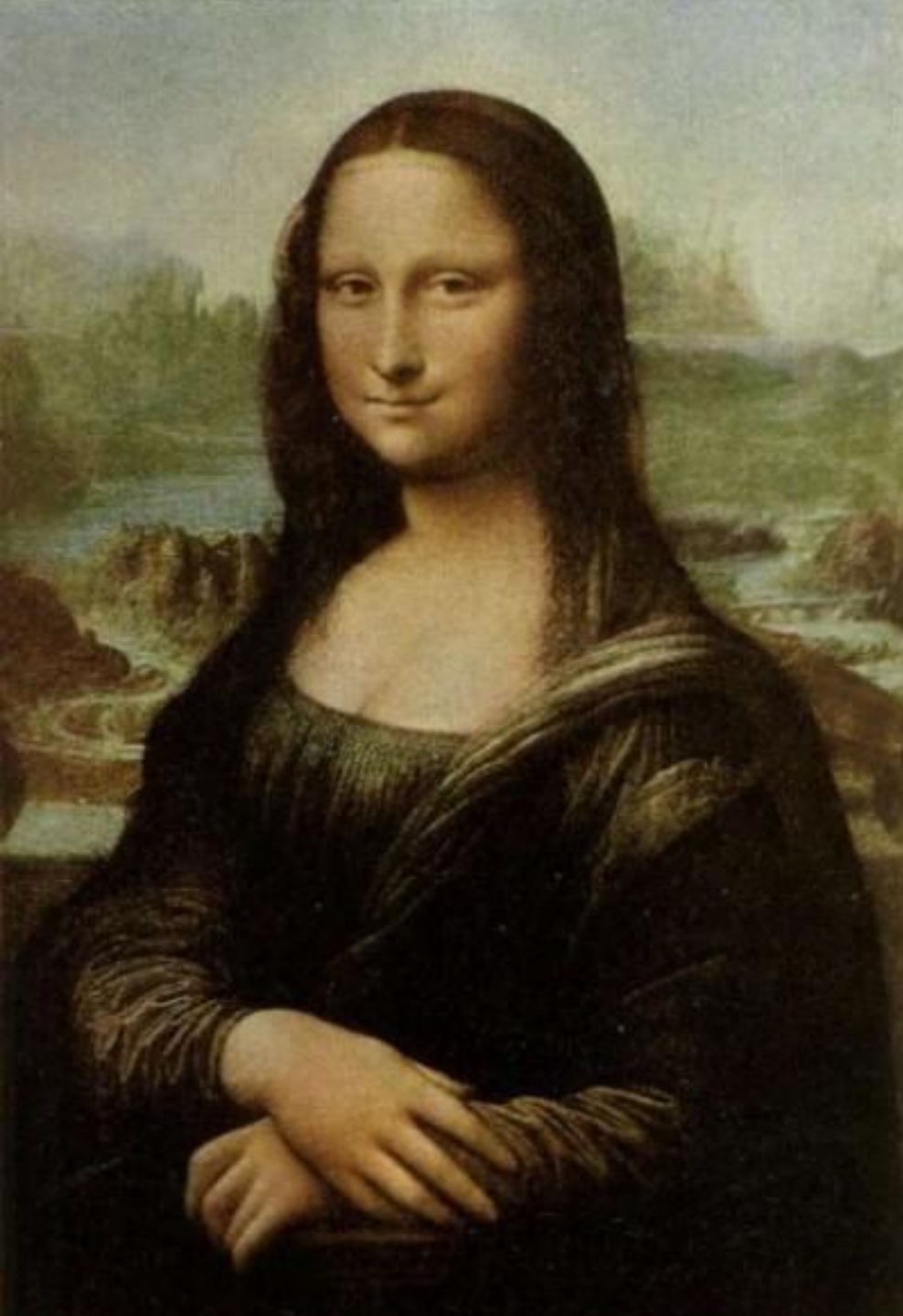
ДЖОКОНДА ЛЕОНАРДО да ВИНЧИ, 1503 г.