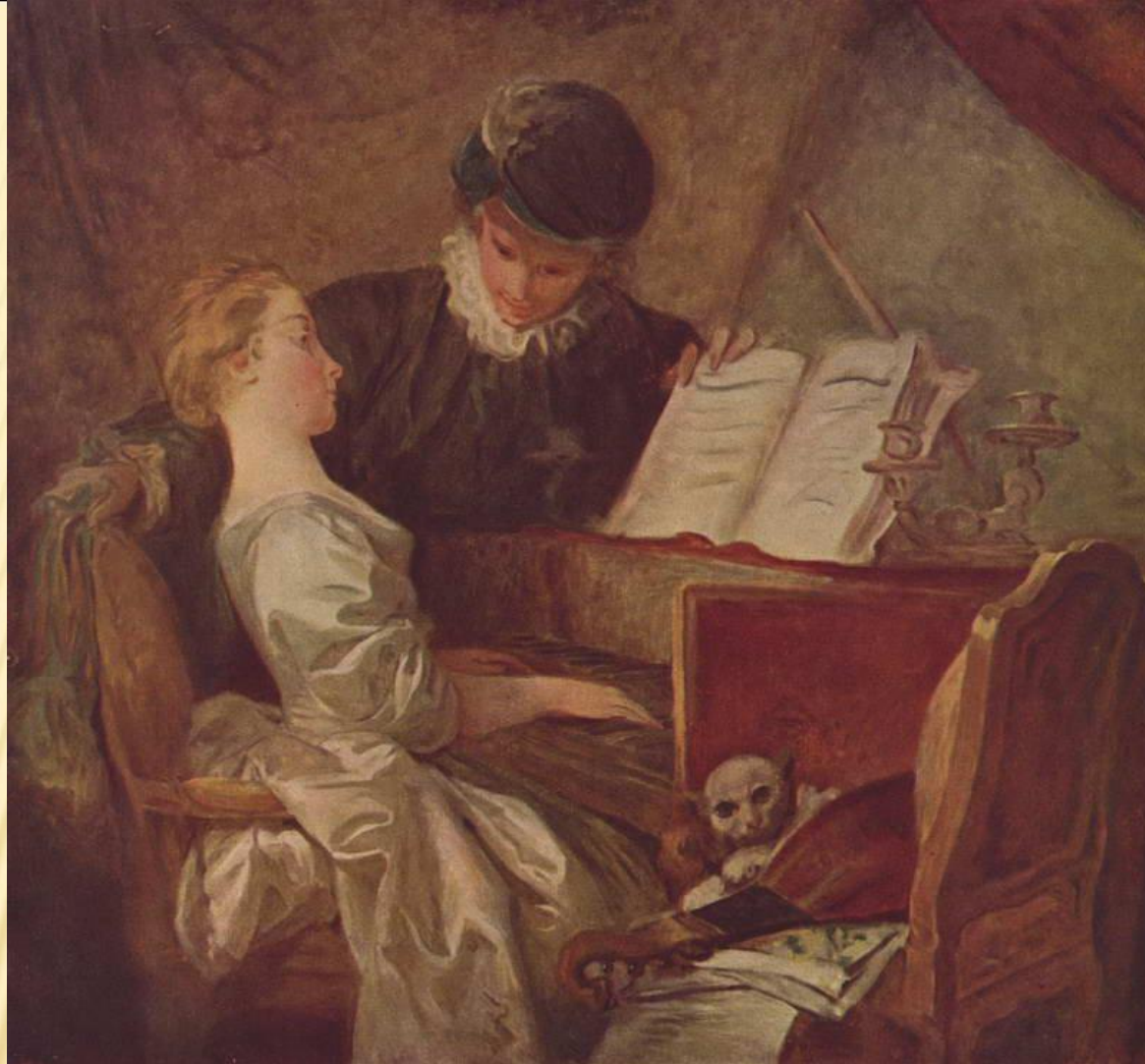
«УРОК МУЗЫКИ», ФРАГОНАР