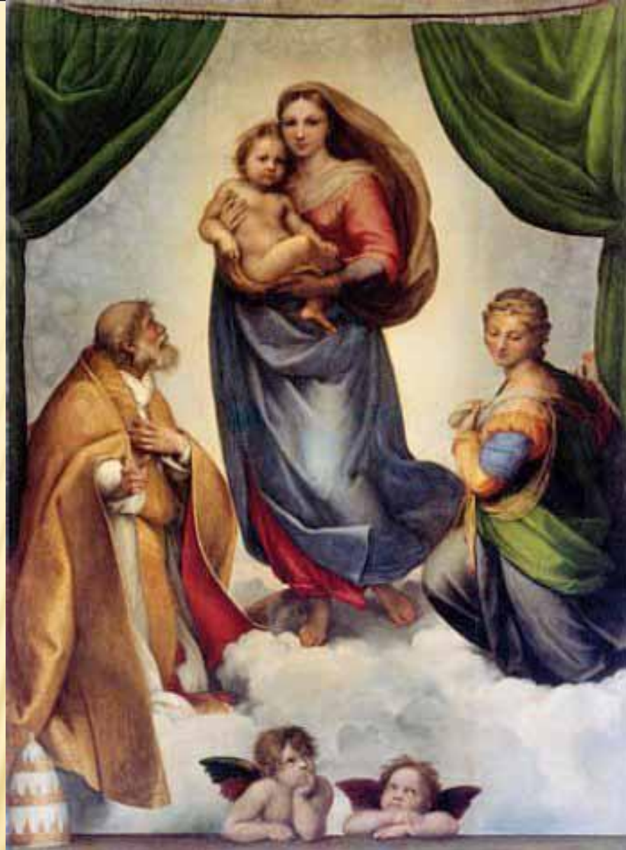
СИКСТИНСКАЯ МАДОННА, РАФАЭЛЬ, 1512 г.