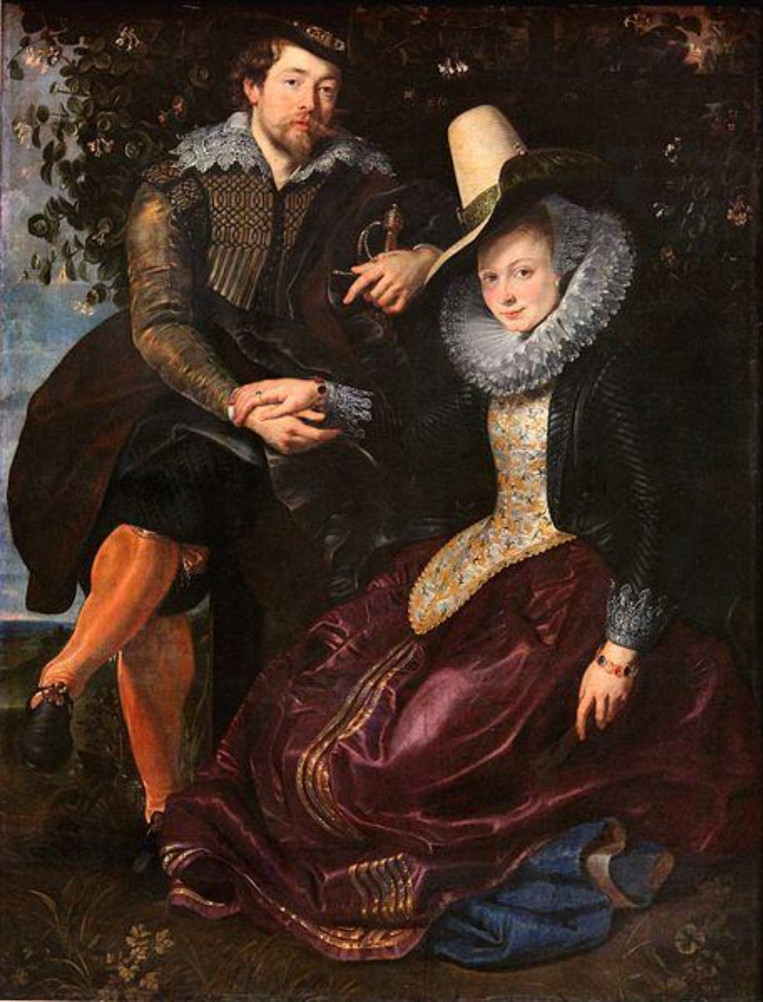
РУБЕНС ПИТЕР ПАУЛЬ «АВТОПОРТРЕТ С ИЗАБЕЛЛОЙ БРАНТ», 1609 г.