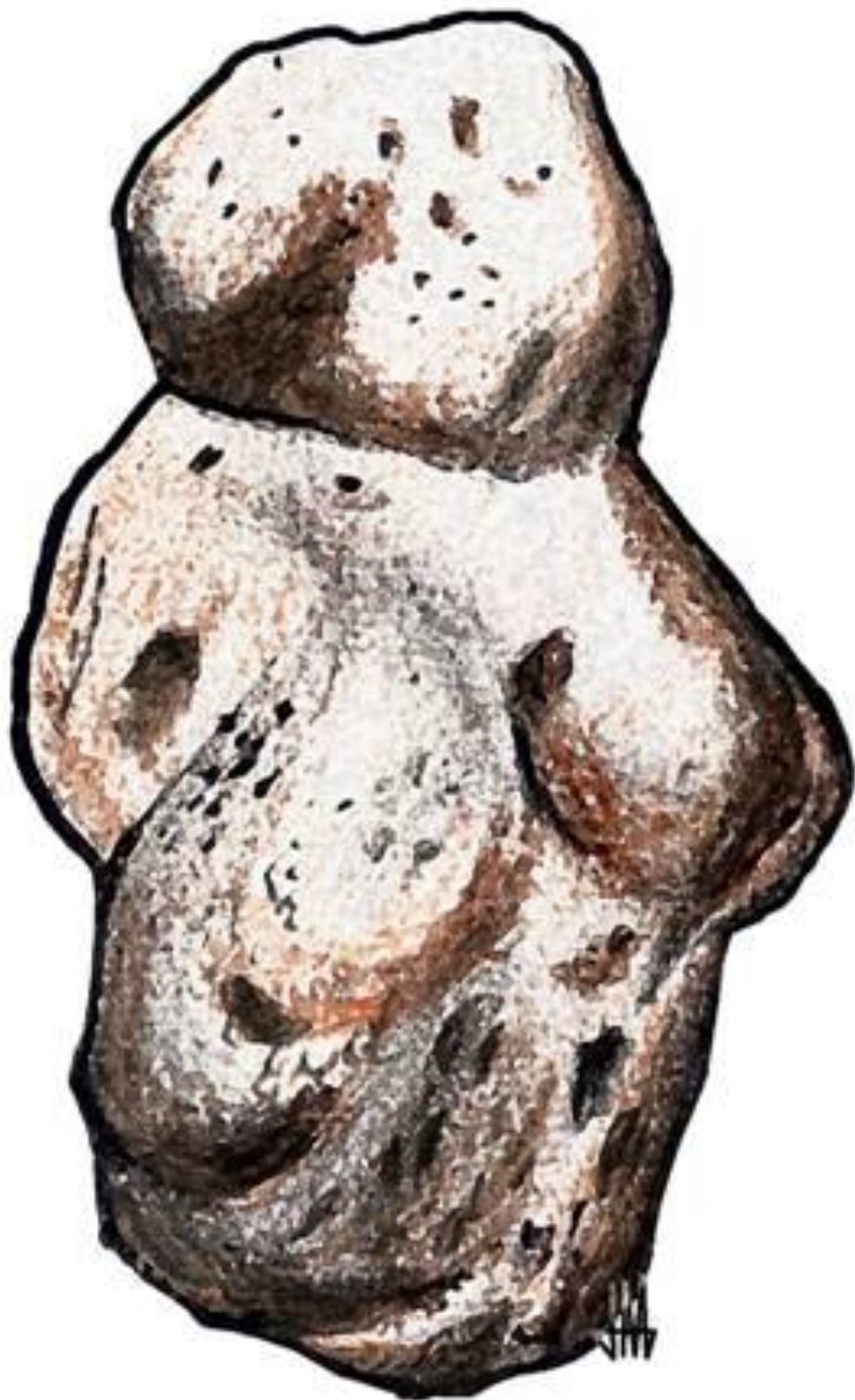
ВЕНЕРА ИЗ БРЕХАТ-РОМА