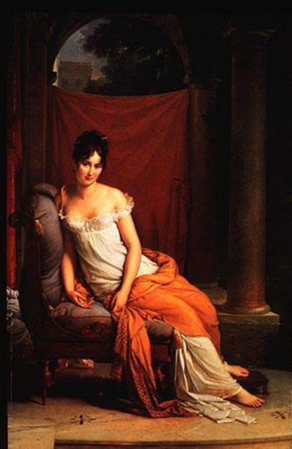
ФРАНСУА ЖЕРАР «МАДАМ РЕКАЛЬЕ»