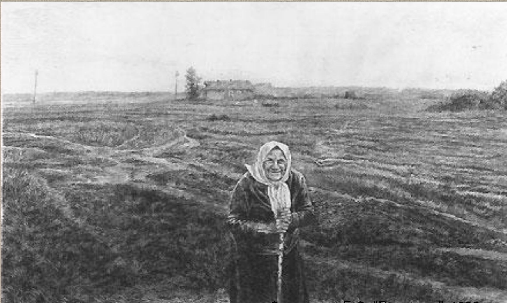
Французов Б.Ф. "Вековуха". 1986. Офорт