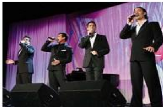
«El Diva». Кларсон «Детская юбка Вилли»