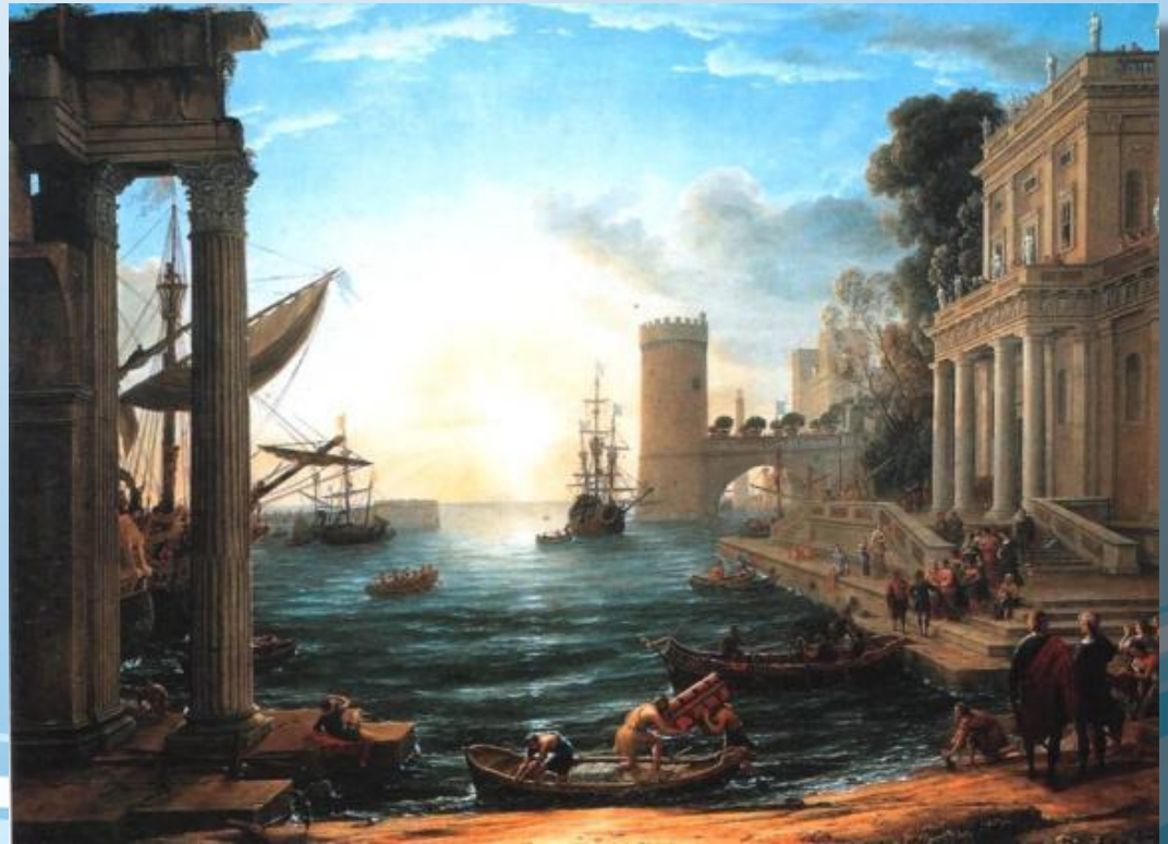
Клод Лоррен «Отплытие царицы Савской»

В живописи главное значение приобрели логическое развертывание сюжета, ясная уравновешенная композиция, четкая передача объема, с помощью светотени подчиненная роль цвета, использование локальных цветов .