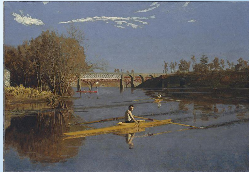
Томас Икинс. «Макс Шмитт в лодке»

Рождение реализма в живописи чаще всего связывают с творчеством французского художника Гюстава Курбе (1819—1877), открывшего в 1855 г. в Париже свою персональную выставку «Павильон реализма». В 1870-е гг. реализм разделился на два основных направления — натурализм и импрессионизм .