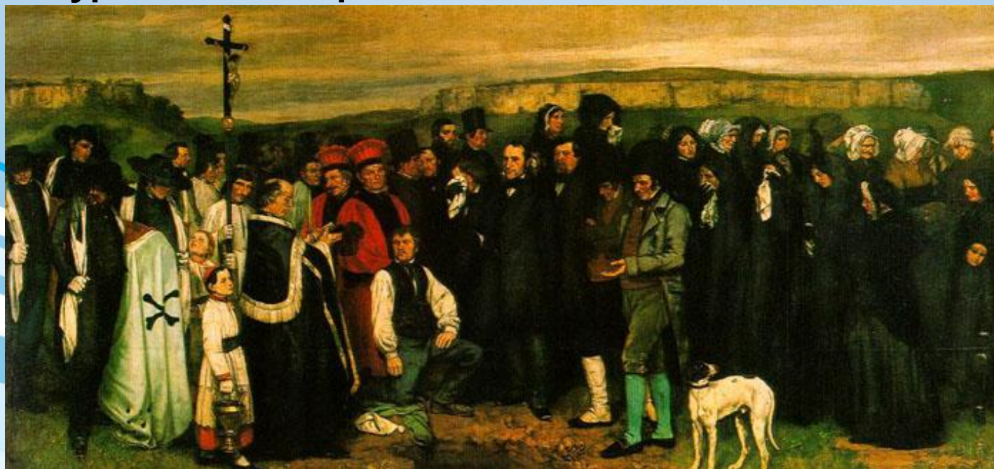
Гюстав Курбе. "Похороны в Орнани". 1849-1850 гг.