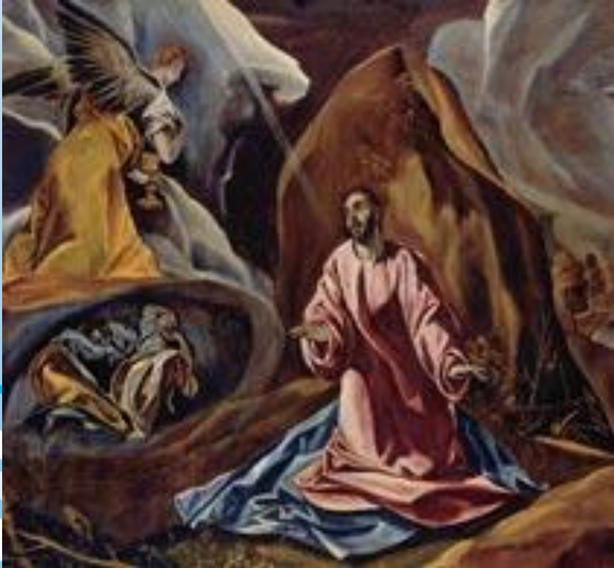
Эль Греко "Христос на Масличной Горе", 1605. Национ. гал., Лондон

Маньеризм (итал. manierismo, от maniera — манера, стиль), направление в западноевропейском искусстве 16 в., отразившее кризис гуманистической культуры Возрождения. Внешне следуя мастерам Высокого Возрождения, произведения маньеристов отличаются усложненностью, напряженностью образов, манерной изощренностью формы, а нередко и остротой художественных решений .