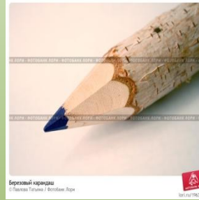
Березовый карандаш