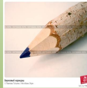
Березовый карандаш