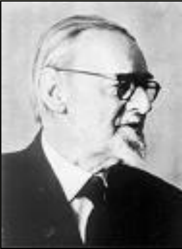
Н. А. Бернштейн