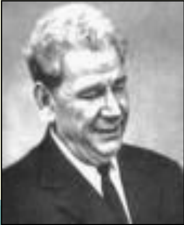
П. К. Анохин

Всю деятельность системы и ее всевозможные изменения можно представить целиком в терминах результата :