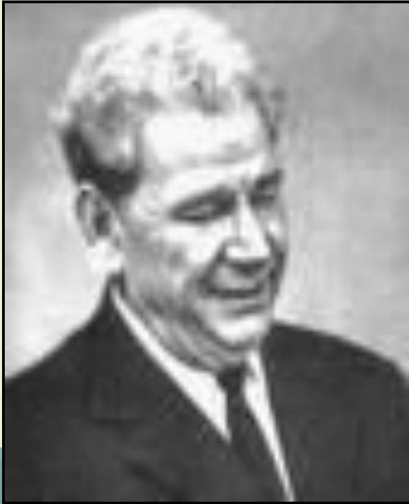
П. К. Анохин