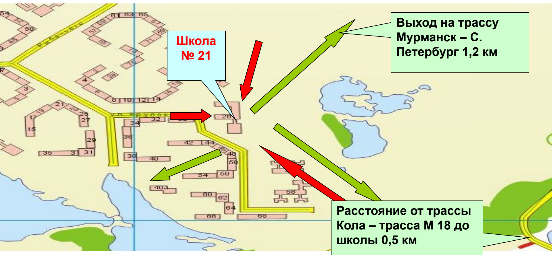
Схема наиболее вероятного проникновения на территорию образовательного учреждения школы № 21 г. Мурманска и отхода террористов во время проведения террористической акции