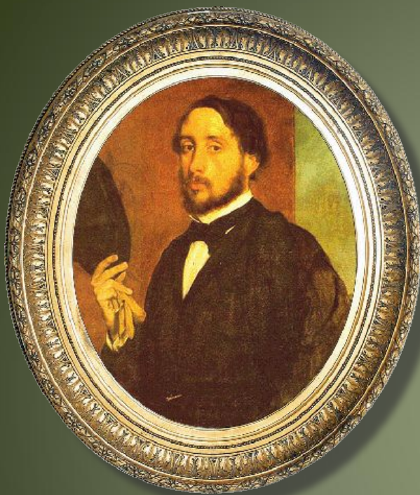
Эдгар Дега Франция, XVIII век