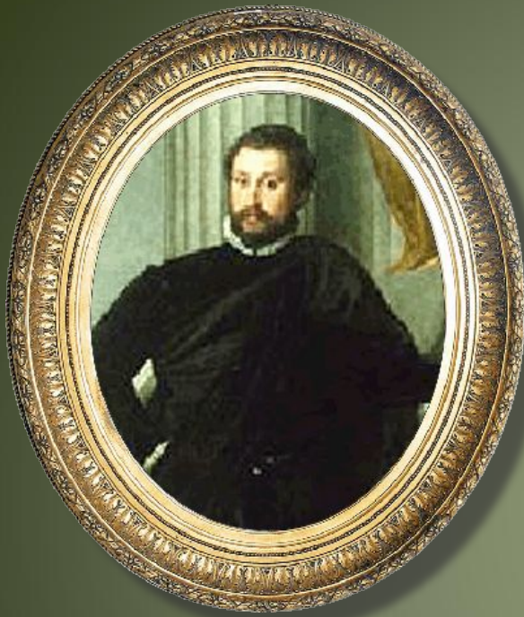
Паоло Веронезе Возрождение, XV век