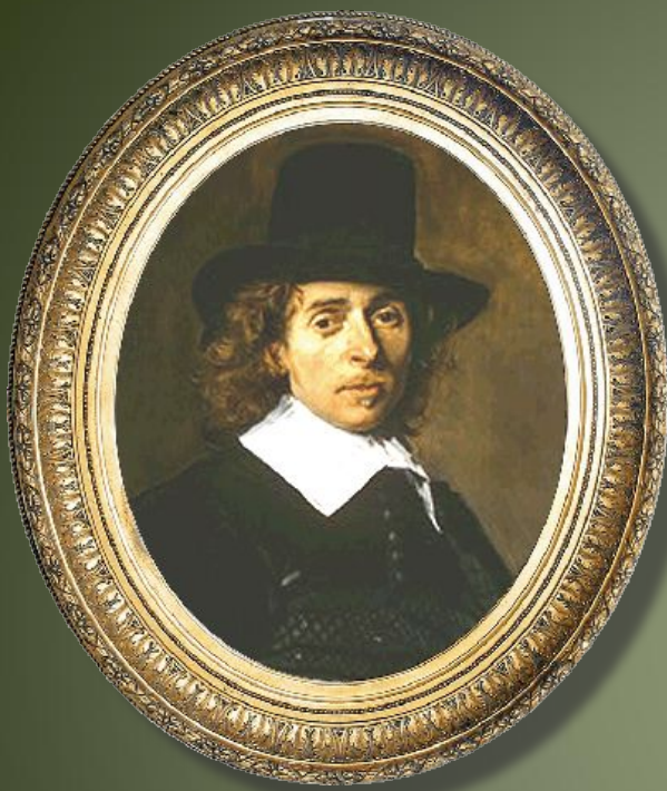
Андриан ван Остаде Голландия, XVII век