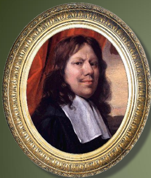
Ян Стен Голландия, XVII век