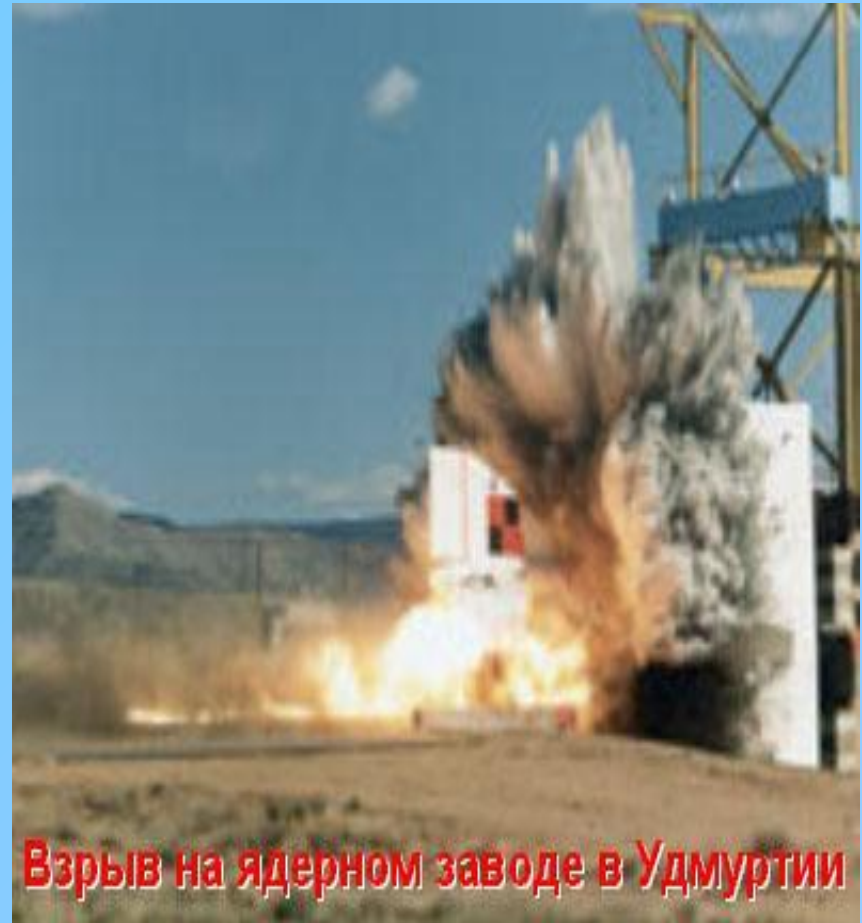
Взрыв на ядерном заводе в Удмуртии