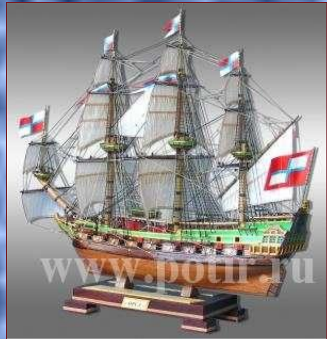
Макет корабля «Орёл»