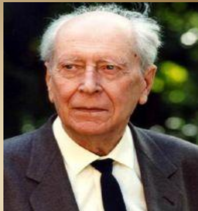
Дмитрий Сергеевич Лихачев

«Любовь к своей стране и своему народу – это и есть начало, которое по-настоящему освящает всю деятельность человека, приносит ему настоящее счастье, избавляет от неприятностей, мелких личных неудач».