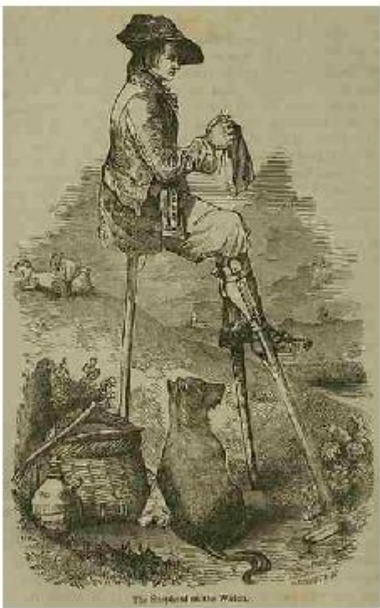
The Shepherd on the Wolds.

Вязание так распространилось среди населения Шотландии в 17-18-м веках, что целые семьи участвовали в изготовлении свитеров, чулков, носков и других аксессуаров.