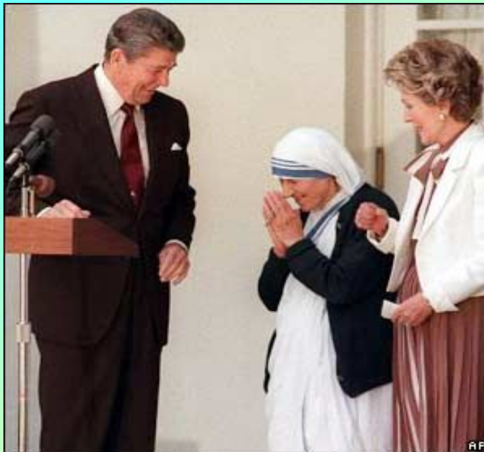
Мать Тереза с президентом США Рональдом Рейганом...

В 1979 г. ей была присуждена Нобелевская премия мира. Полученные средства она истратила на строительство приютов для бедных, в частности для страдающих проказой.