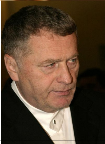
Владимир Вольфович Жириновский

Радикальная партия, выступающая за сильное государство, которому должны быть подчинены интересы всех его граждан.