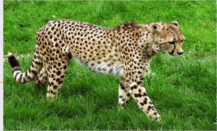
Гепард- больше 100 км/ч