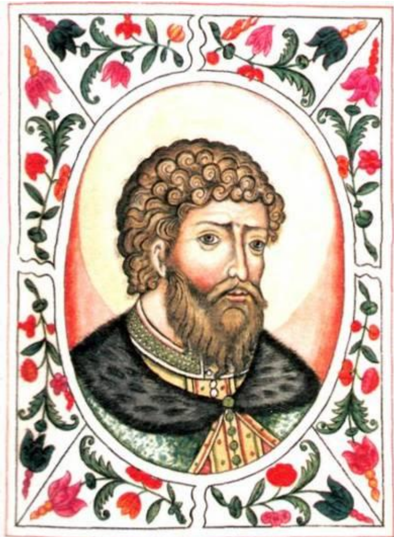
Беликий князь киевский Ярослав Мудрый

В правление князей Владимира и его сына Ярослава Мудрого наступает расцвет Древней Руси. К этому времени в её состав вошёл весь русский народ. Создание государства остановило нападения варягов на севере. Спокойнее стала и южная граница, где князь Владимир нанёс