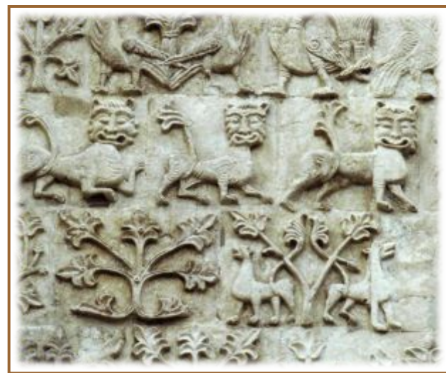
Дмитр овский собор во Влади мире