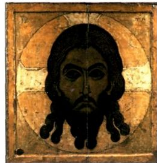
СПАС НЕРУКОТВОРНЫЙ. НОВГОРОДСКАЯ ШКОЛА. СЕРЕДИНА XII В.