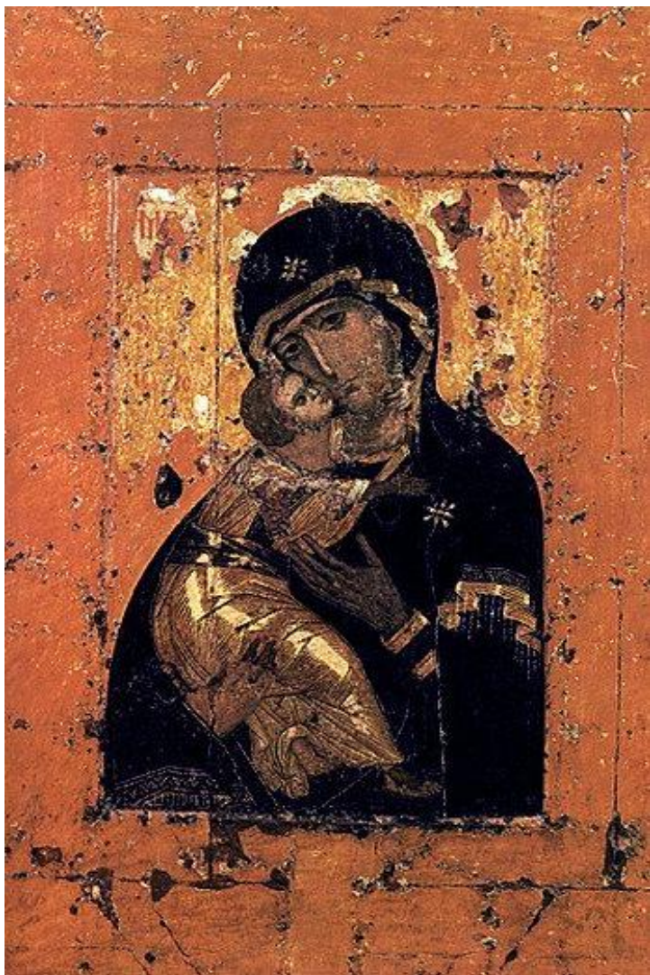
Владимирская икона Божьей матери XII век