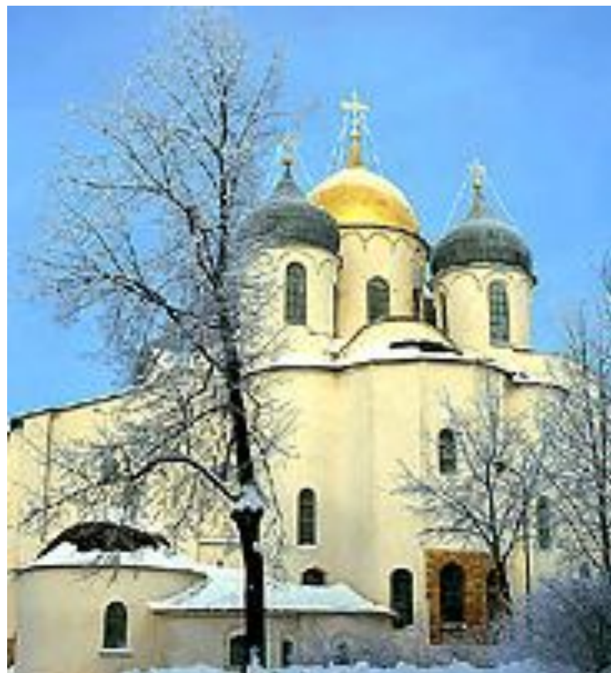
Софийский собор в Новгороде