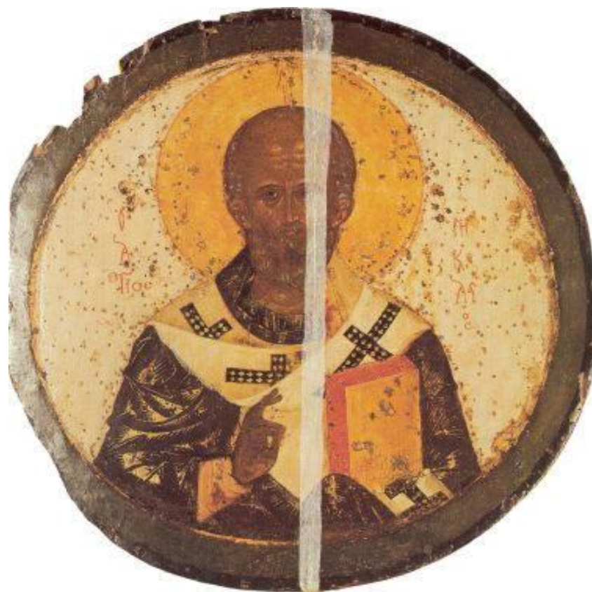
Святитель Николай, Новгород XII век