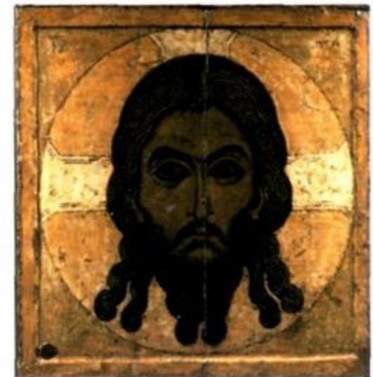
СПАС НЕРУКОТВОРНЫЙ. НОВГОРОДСКАЯ ШКОЛА. СЕРЕДИНА XII В.