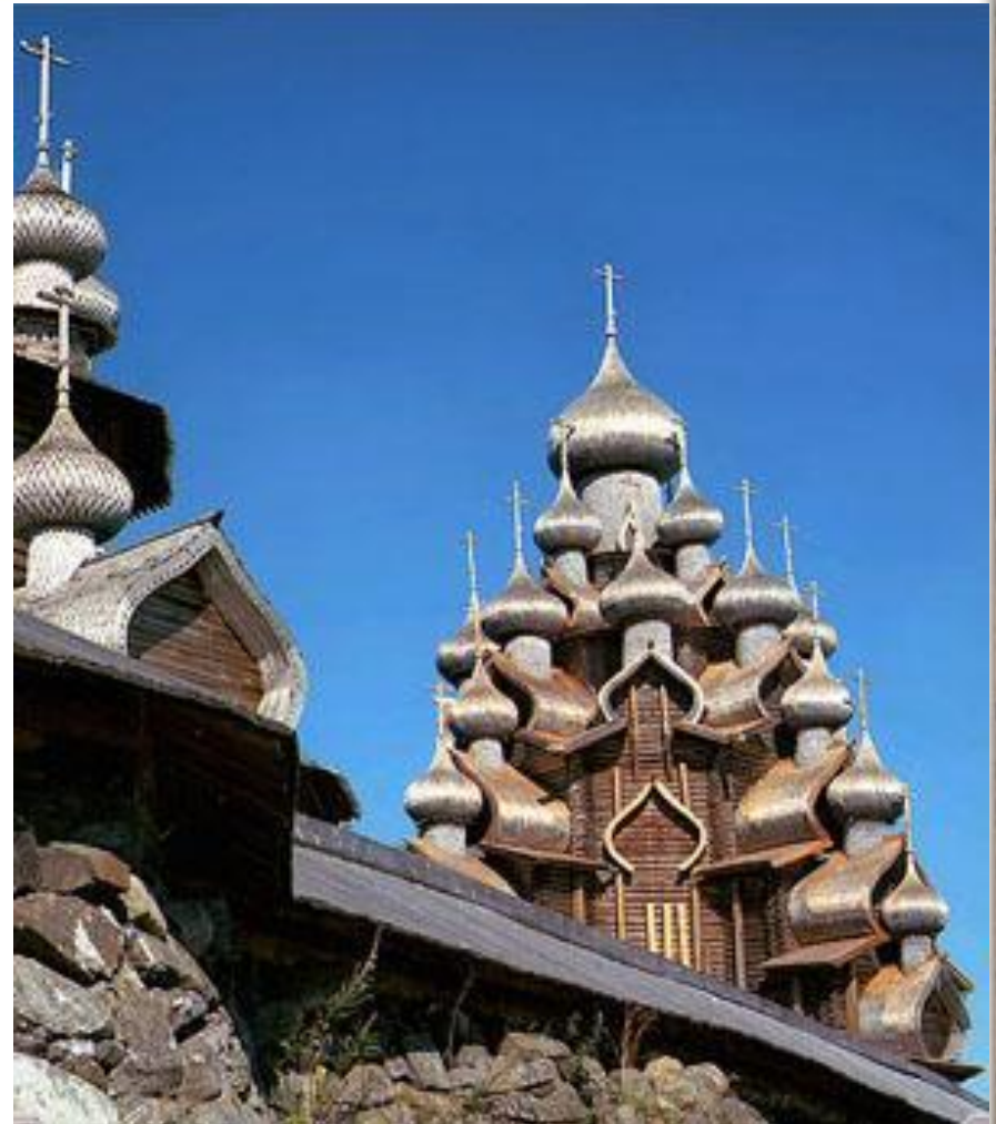
Купола Преображенской церкви