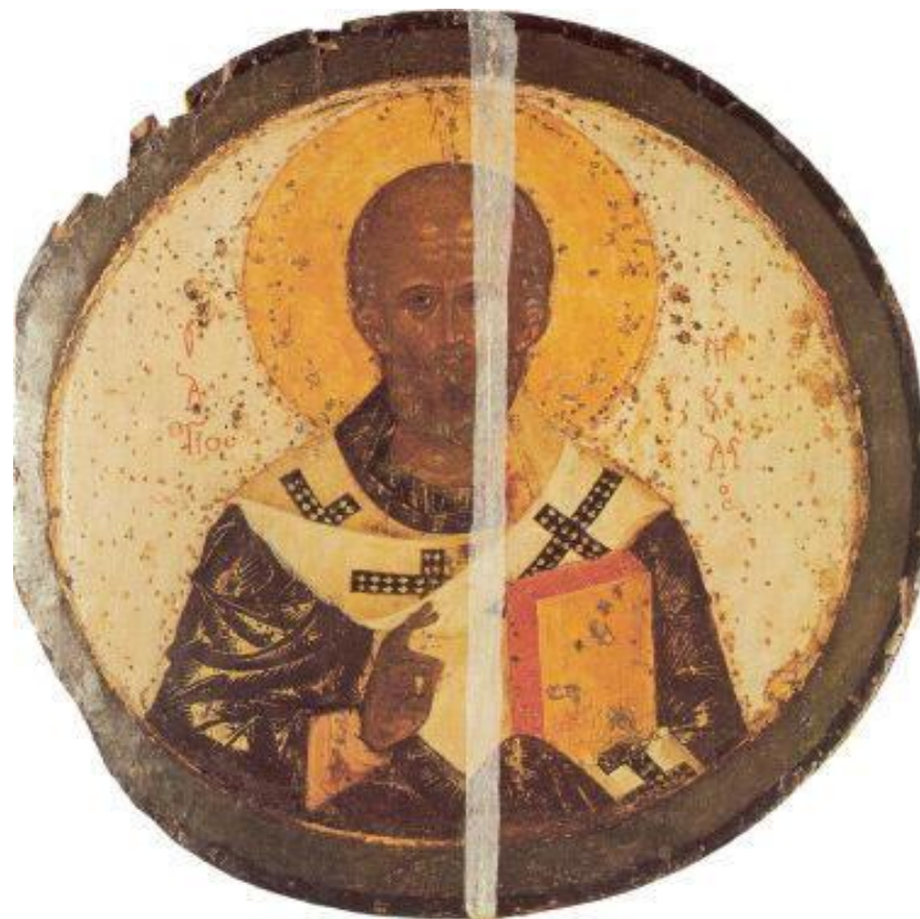
Святитель Николай, Новгород XII век