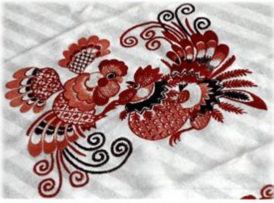
1307146 — Вологодский музей-заповедник Вышнего. Фрагмент гобелена «Горький слез» (Владимирский собор).