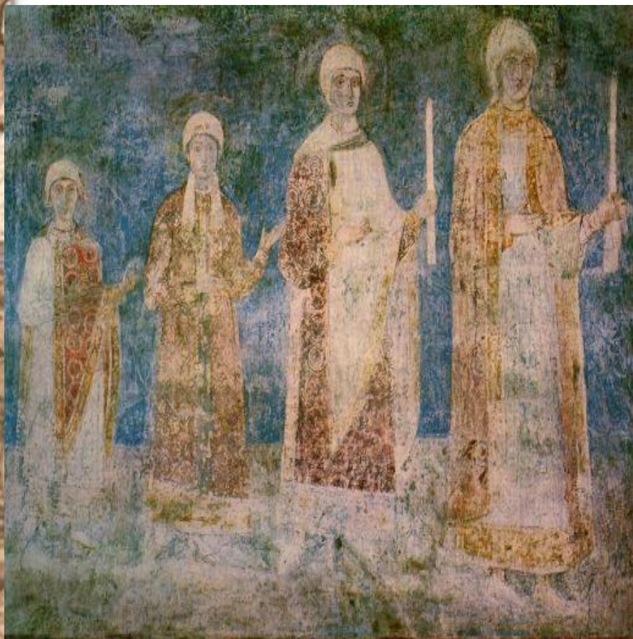
Семейство Ярослава Мудрого Киев, Святая София, XI век