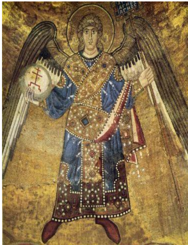
Архангел Киев, Святая София, XI век

МОЗАИКА – рисунок или узор из скрепленных между собой разноцветных камешков, кусочков стекла.