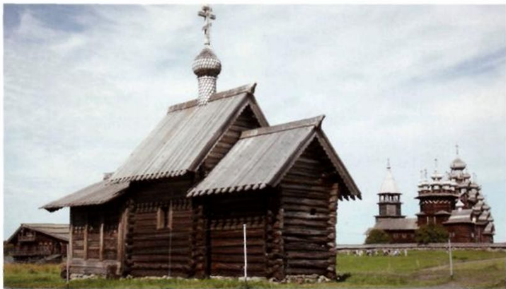
ЦЕРКОВЬ ВОСКРЕШЕНИЯ ЛАЗАРЯ ИЗ МУРОМСКОГО МОНАСТЫРЯ. САМАЯ СТАРАЯ ДЕРЕВЯННАЯ ПОСТРОЙКА НА ТЕРРИТОРИИ РОССИИ.